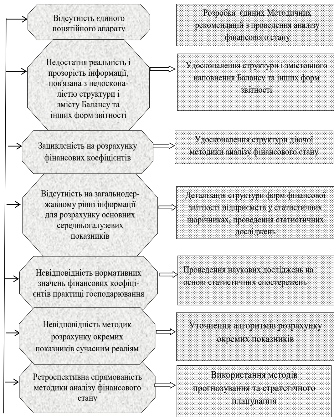
Рис. 1. Теоретико - методичні проблемні питання аналізу фінансового стану підприємств та напрями їх вирішення

для своєчасного проведення розрахунків за зобов'язаннями та здійснення ефективної господарської діяльності у майбутньому” [6].