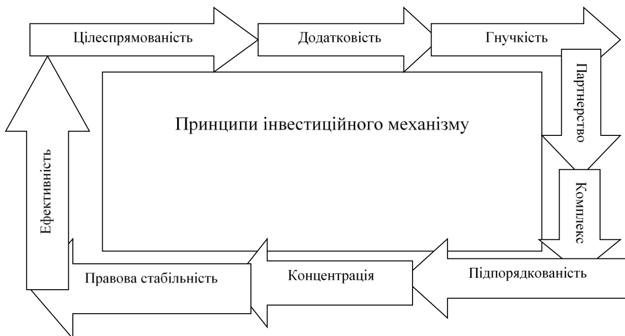
Рис. 2. Цикл реалізації принципів інвестиційної діяльності підприємств аграрної сфери