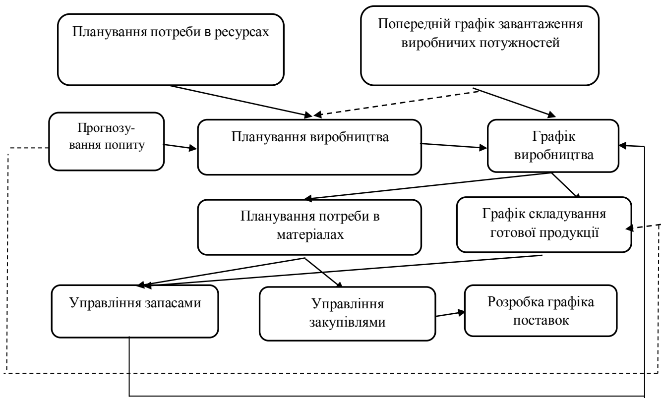
Рис. 2. Схема мікрологістичної системи KANBAN

- підвищена професійна відповідальність та висока трудова дисципліна всього персоналу.