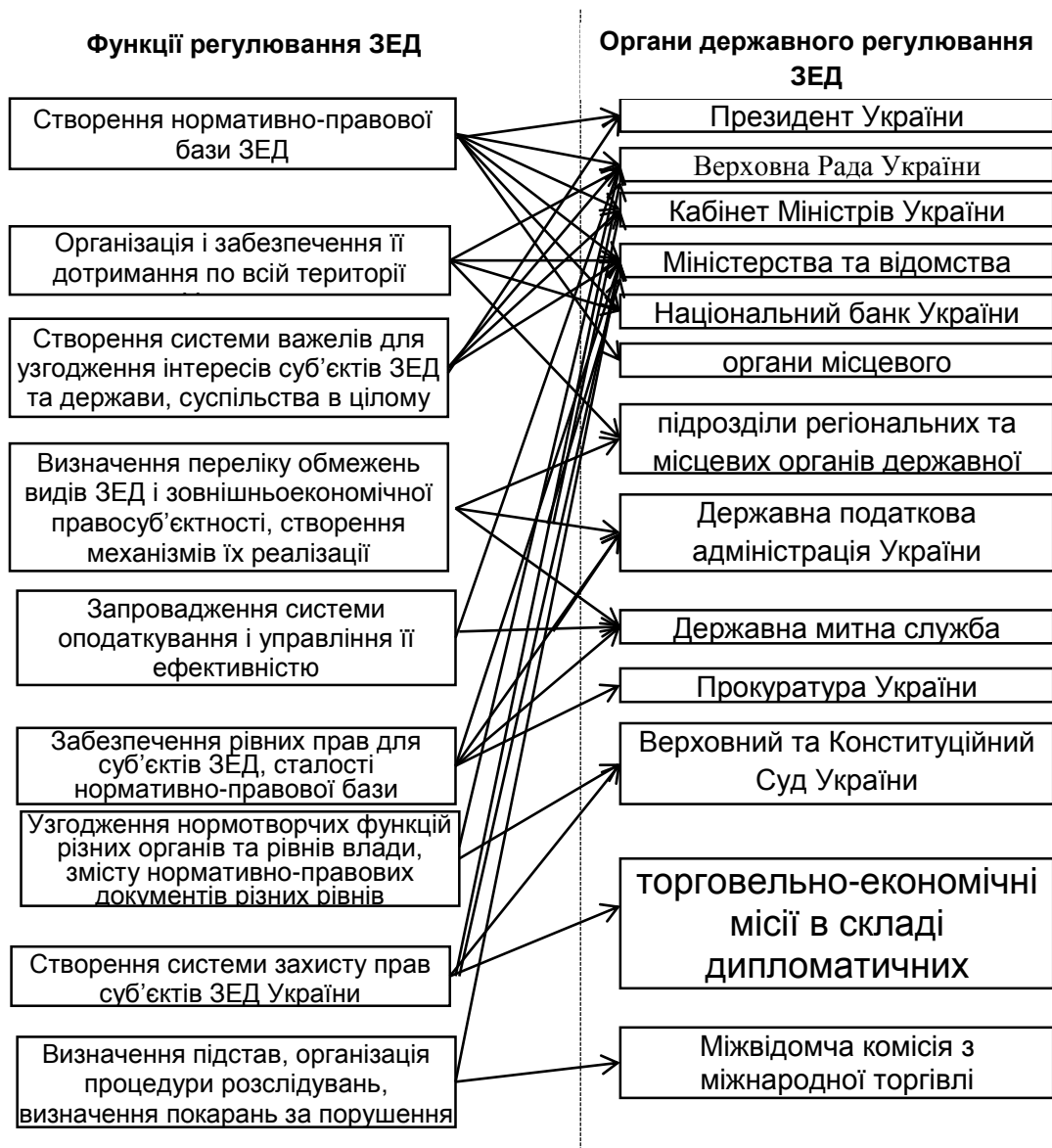
Рис. 2. Функції державного регулювання зовнішньоекономічної діяльності органами державного регулювання ЗЕД

Головною метою фінансового механізму є обслуговування та підтримка всіх видів зовнішньоекономічної діяльності, тобто даний механізм є потужним інструментом провадження фінансової політики держави, який є важливим не тільки для держави, а й для суб'єктів підприємницької діяльності за рахунок створення позитивного іміджу країни та поповнення валютних резервів, що дозволяє суб'єктам господарювання більш раціонально використовувати економічний потенціал, отримувати доступ до нових технологій, завойовувати нові ринки збуту продукції. При комплексному аналізі зовнішньоекономічної діяльності охоплюється вся взаємопов'язана сукупність показників, що відображають повністю або частково господарську, виробничо-комерційну й фінансову діяльність суб'єктів господарювання щодо реалізації зовнішньоекономічних відносин. Враховуючи такі методологічні передумови, важливо проаналізувати особливості фінансового механізму ЗЕД з урахуванням його складових, а саме: механізму митно-тарифного регулювання ЗЕД, валютно-фінансового механізму,