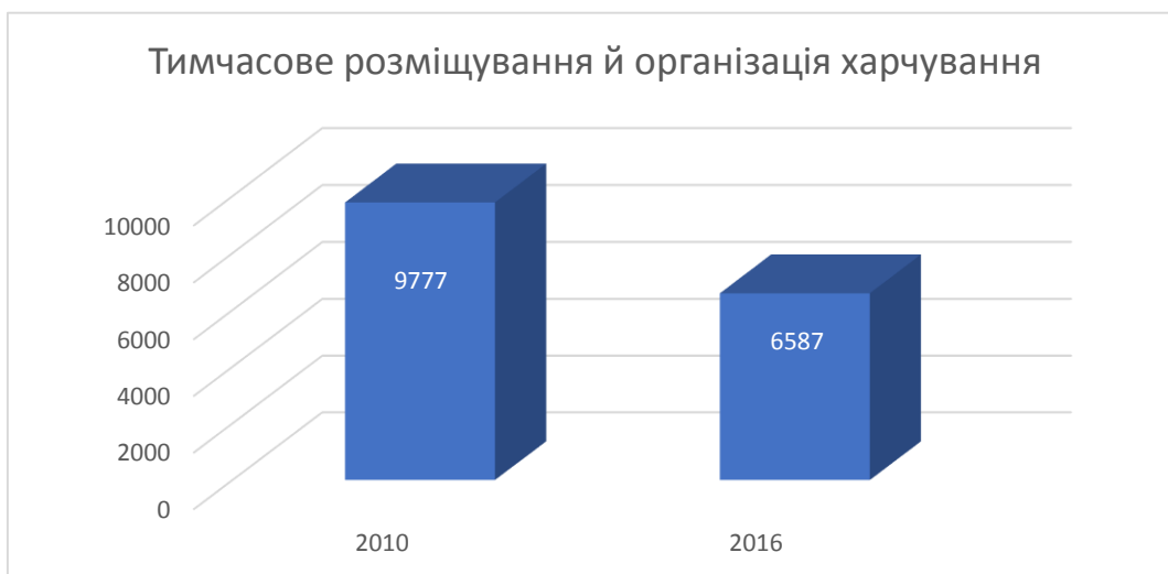
Рис. 2. Кількість підприємств з тимчасового розміщування й організації харчування в Україні (одиниць)