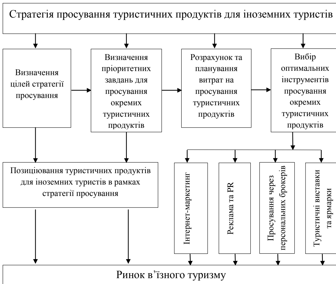
Рис. 2. Механізм реалізації стратегії просування туристичних продуктів для іноземних туристів

У науковій та навчальній літературі можна побачити велику кількість визначень, котрі у той чи інший спосіб окреслюють сутність та завдання маркетингових стратегій просування у сфері туризму. На наш погляд, просування туристичного продукту – це поєднання різних заходів та інструментів комунікації з цільовими споживачами туристичних послуг та іншими учасниками туристичного ринку з метою забезпечення ефективного продажу різних видів туристичних продуктів. Туристичні продукти можна просувати через організацію рекламних кампаній, через персональних туристичних брокерів, участь у спеціалізованих виставках, туристичних ярмарках, організацію туристичних інформаційних центрів, видання каталогів, буклетів та з широким використанням ресурсів Інтернету. Таким чином, основним завданням стратегії просування на туристичному ринку є проведення різних видів діяльності по доведенню інформації про переваги продукту до потенційних туристів і стимулювання виникнення у них бажання його придбати. Практична реалізація стратегії повинна відбуватися через відповідний механізм, сформований із послідовних та взаємозалежних етапів (рис. 2).