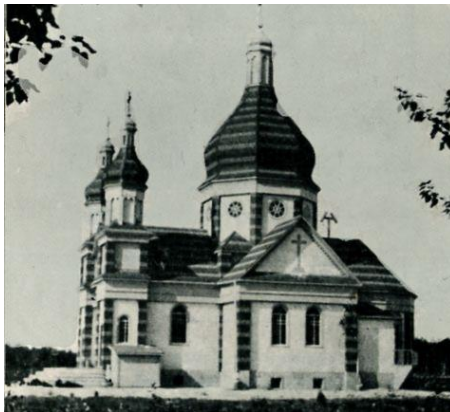
Рис. 2. Церква Пресвятої Тройці в Мінк Крік, Манітоба (арх. о. Пилип Ру).

Храми пізнішого періоду вже відображають власне канадський тип української церкви, який сформувався внаслідок складної еволюції сакральної української архітектури в Канаді. Ці церкви хрещаті у плані, фронтальне рамено дещо витягнуте, що нагадує про еволюцію хрещатої церкви з базиліки, мають одну велику баню посередині та дві менші по боках. Фронтальний фасад нагадує латинські готичні собори з вестверками та розою в центрі, проте куполи вказують на українські барокові стильові риси. Сьогодні важко стверджувати, що було передосновою формування типового плану української церкви в Канаді: чи це були католицькі храми романської доби, а потім готичної, коли одній чарунці середнього нефа відповідають дві з кожного боку, чи пам'ять про хрещаті українські церкви, а, можливо, гібрид двох планів. Хоча, належить зазначити, що українці Канади надали перевагу хрестово-купольному конструктивному вирішенню даху, а не перехресному склепінню, як це зустрічаємо у латинських соборах зі зв'язаною системою.