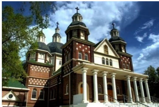
Рис. 3. Церква Святого. Йосафата в Едмонтоні (арх. о. Пилип Ру).

наступних задумах сміливо поєднує українські традиційні мотиви, ренесансні риси та фрагменти класицизму. Такими еkleктичними творіннями великого подвижника стали церкви Св. Йосафата в Едмонтоні (рис. 3) та церква Непорочного зачаття, завершення якої о.Ру так і не побачив (рис. 4, 5).