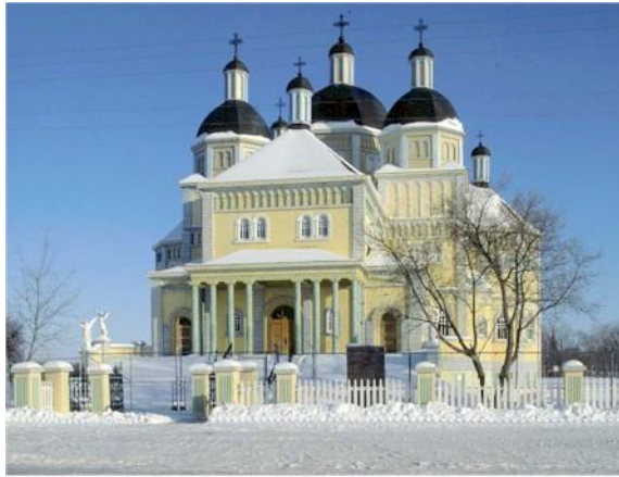
Рис. 4. Церква Непорочного Зачаття в Кукс Крик (арх. о. Пилип Ру).