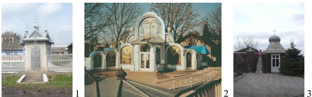
Рис. 1. «Каплички» у структурі садиби: 1. Івано-Франківська обл., 2. Тернопільська обл., 3. Чернівецька обл.