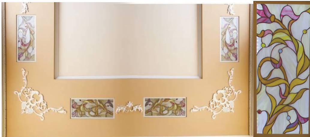
Рис. 2. Вітраж, виконаний для декору стелі: а) фрагмент стелі; б) вітражний елемент.