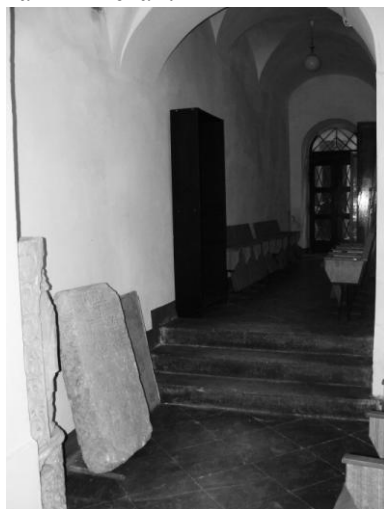
Рис. 5. Коридор, наявний стан.