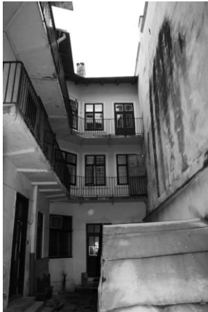
Рис. 2. Внутрішній двір, наявний стан.