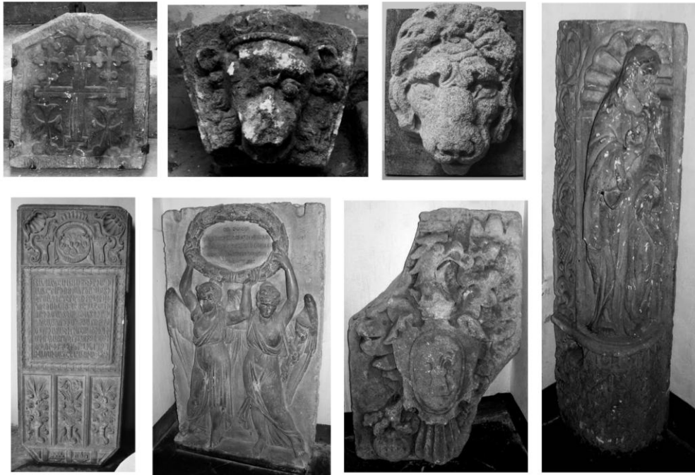
Рис. 1. Фотофіксації деяких елементів для експозиції.

Пам'ятки пов'язані між собою тематичними принципами відповідно до одного стилю, автора. У проекті використані наявні документи, такі як про реєстрацію та документування предметів зібрання, усі їх характеристики.