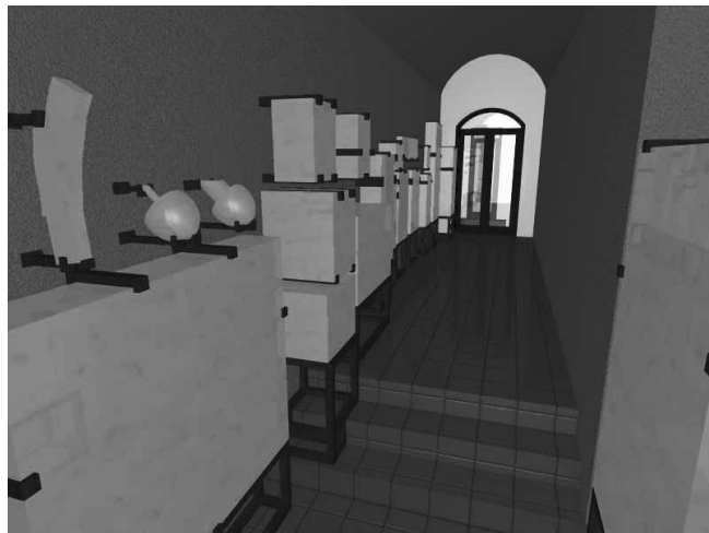
Рис. 6. Візуалізація розміщення експозиції.

Створені ескізи передпроекту, натурні обстеження, креслення, розроблені плани та візуалізація з оформленням супровідної інформації. На кафедрі реставрації архітектурної та мистецької спадщини за правилами охорони архітектурної пам'ятки були виконані реставраційні, консервуючі та частково реконструювальні дії зі збереження. З натурних обстежень виявлено наявність частин пошкоджених ділянок на стінах та в підлозі коридору і дворика (варто використати матеріали та технології, що не зашкодять їх відновленню). У дворі пошкоджені бетонні плити в підлозі потрібно замінити й перекласти на нові. З урахуванням ергономічних норм та всіх вимог ми виконали креслення конструкції, на якій будуть кріпитися експонати, розміщені вздовж стін. Основа нашого проекту