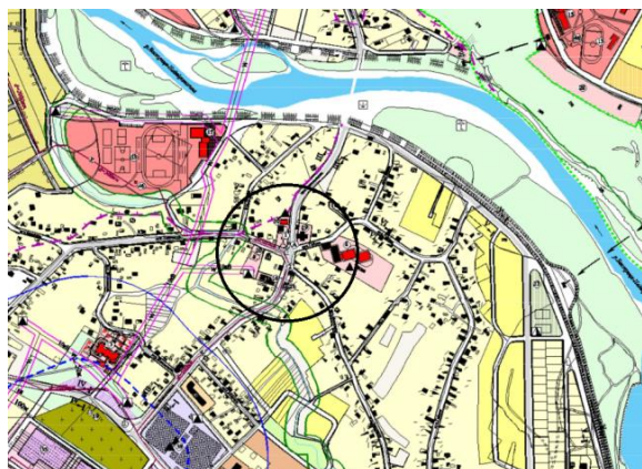
Рис. 1. Фрагмент схеми генерального плану с. Вовчинець (Івано-Франківська область) [9]