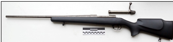
Рисунок 2. Карабін «AZ 1900» після неповного розбирання.

Запобігання випадковому пострілу та процес приведення зброї у бойову готовність виконується лише при ручному зведенні та спуску курків – зведення пружини ударника дією вперед шибера на верхній частині шийки ложа.