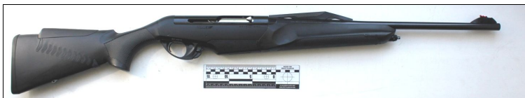
Рисунок 5. Карабін «Argo E Comfortech», вигляд з правого боку.