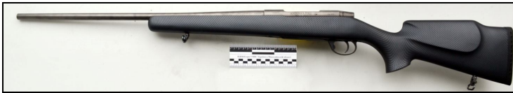
Рисунок 1. Карабін «AZ 1900», вигляд з лівого боку.

Особливим у модельному ряду є класичний болтовий карабін (карабін з повздовжньо-ковзаючим поворотним затвором) «AZ 1900» виробництва Zoli Antonio Srl, що випускається під 12 різних типів патронів у дев'яти варіантах виконання (рис. 1, 2).