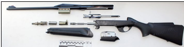
Рисунок 6. Карабін «Argo E Comfortech» після неповного розбирання.

Ствол карабіну циліндричної форми, довжиною 505 мм. Канал ствола всередині має чотири нарізи правого нахилу.