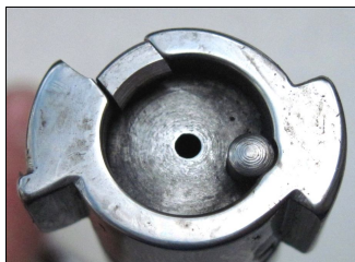
Рисунок 3. Чашка затвору карабіну «AZ 1900».