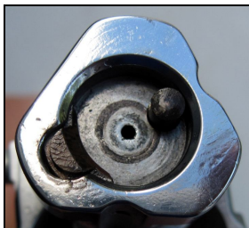
Рисунок 7. Чашка затвору карабіну «Argo E Comfortech».