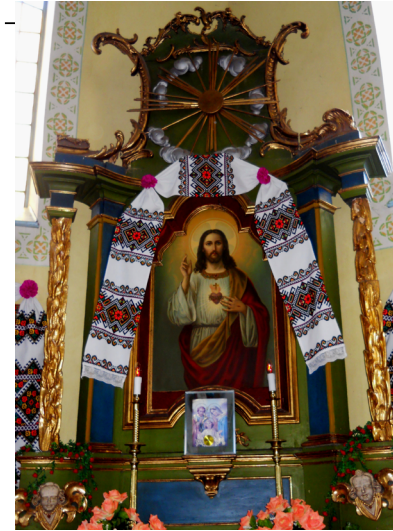
Бічний вітвар Серця Христового. Церква Успення Пресвятої Богородиці. Друга пол. XVIII ст., с. Вербів, Тернопільська обл.

Ключевые слова: алтарь, gloria, завершения, икона, картуш, обрамление, пилястры, рокайль, ярус.