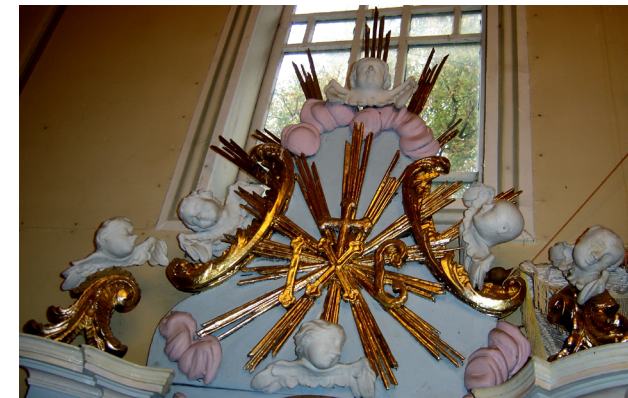
Завершення вітваря Вознесіння Христового. Церква св. Миколая. Друга пол. XVIII ст., с. Надрічне, Тернопільська обл.