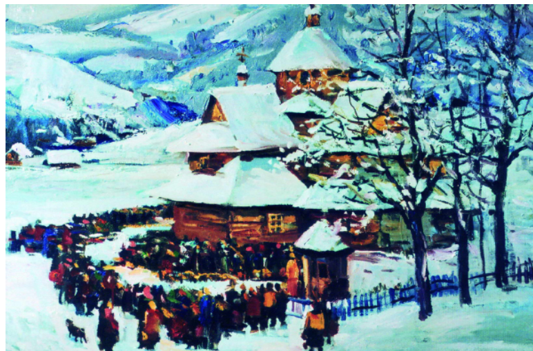
Водохрестя. 2006 р.