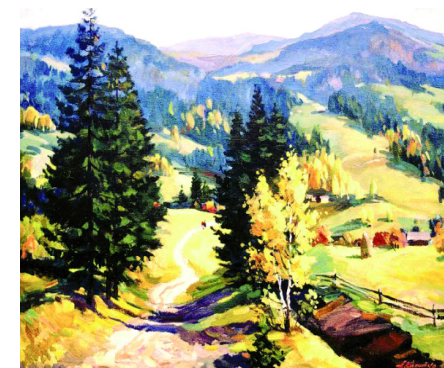
Карпатська осінь. 2010 р.