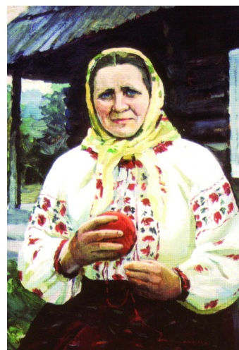
Портрет лауреата Державної премії ім. Т. Шевченка Ганни Василяшук. 1973 р.