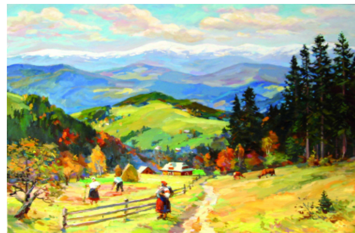
Теплий день. Бистрець. 2001 р.