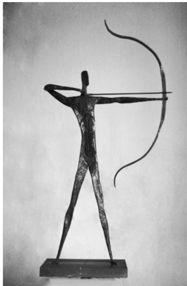
"Лучник". 100x60, 1983 р. О. Боньковський