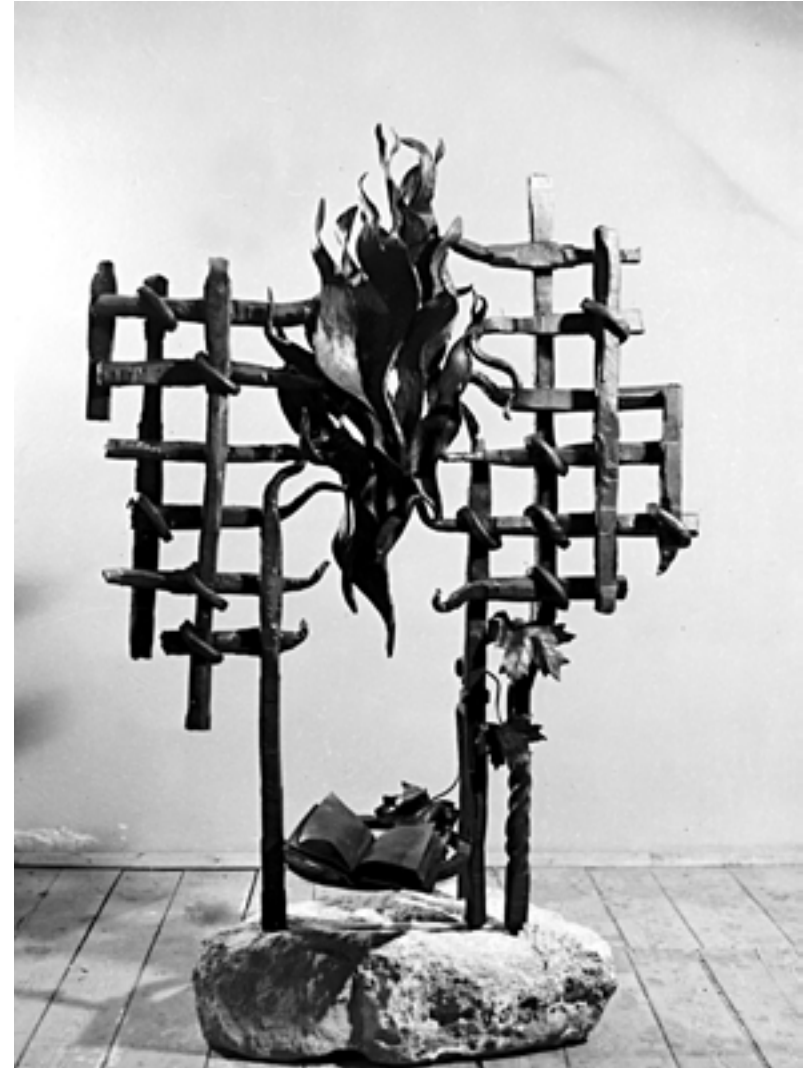
"Дай і огню". 150х100, 1986 р. О. Боньковський