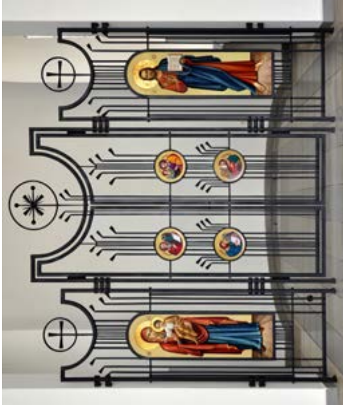
М. Боньковська (ікони), О. Боньковський (метал) Іконостас каплиці Благовіщення Онуфрієвського монастиря. 250х300, 2005 р., Львів