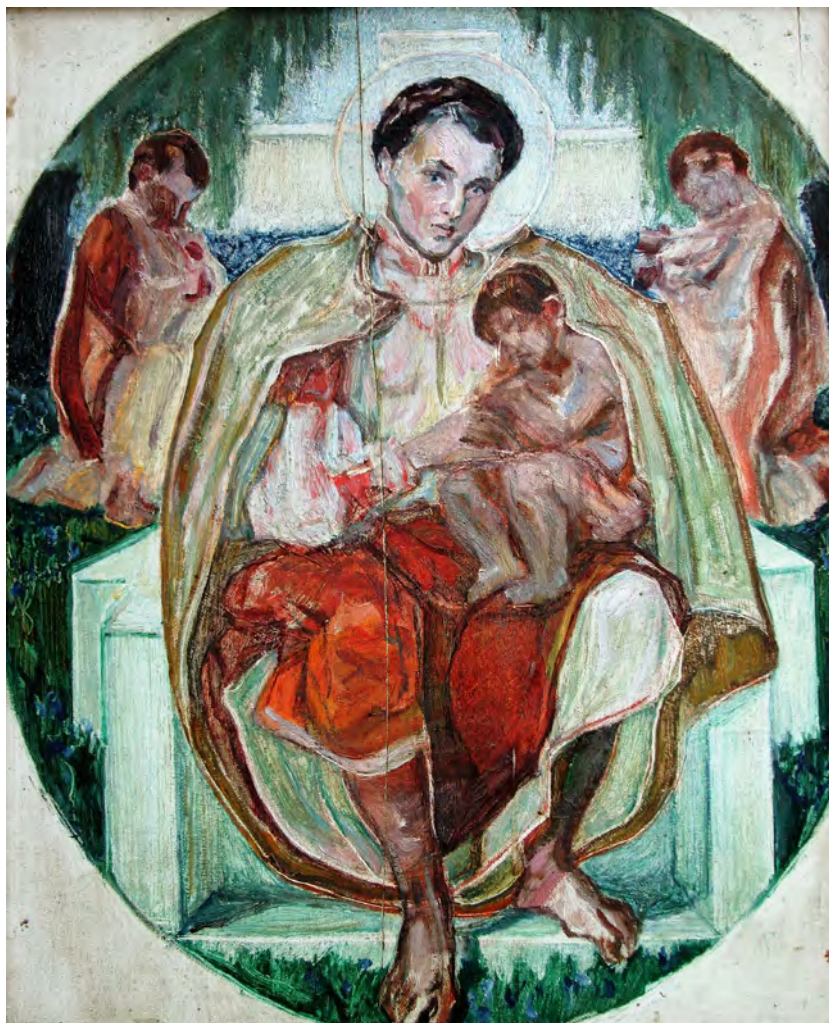
“Марія” (за мотивами однойменної поеми Т. Шевченка “Марія”). 1914 р.