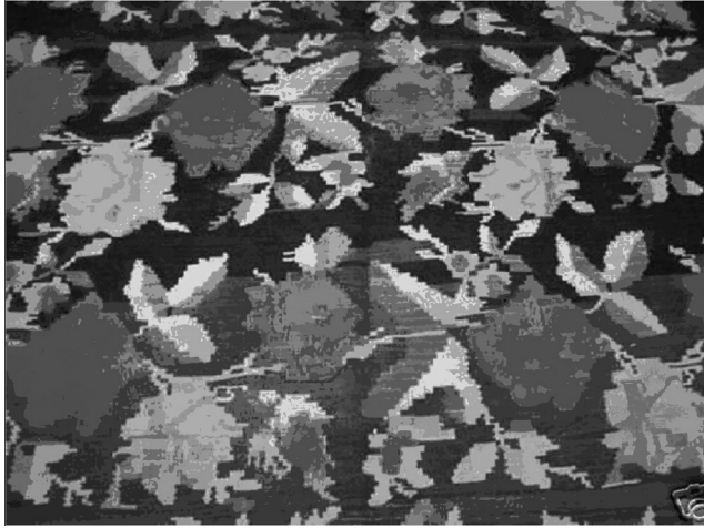
Бессарабський килим. Кін. XIX ст.