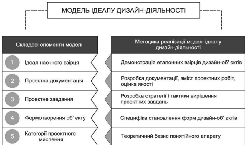
Модель ідеалу дизайн-діяльності Рисунок Юрченко І.А.