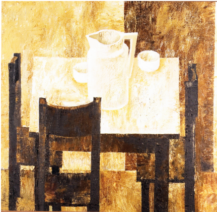
Натюрморт з глечиком. П., о. 1970 р.