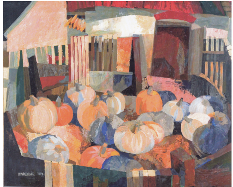
На подвір'ї. Осінній натюрморт. П., о. 1970 р.