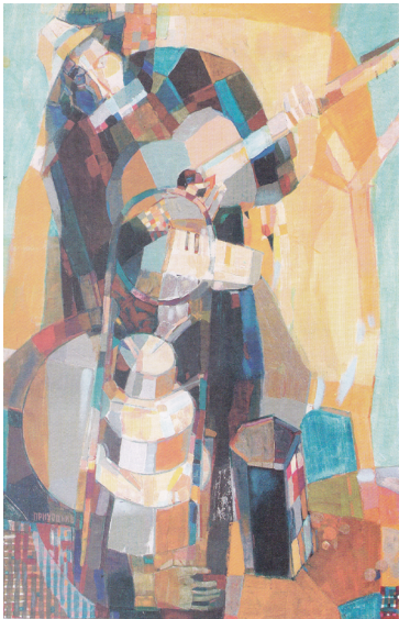
Український музикант І. П., о. 2003 р.