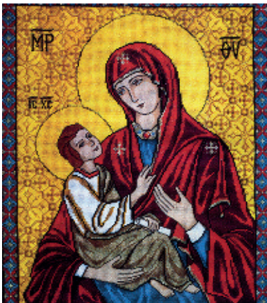
7. Холмська Богородиця;