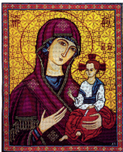
15. Луцько-Волинська Богородиця;