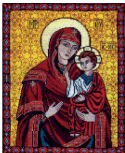
12. Тербовельсько-Львівська Богородиця;