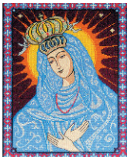
13. Остробрамська Богородиця;