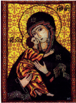
1. Вишгородська Богородиця;