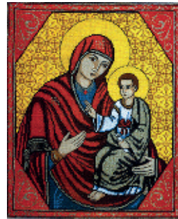
6. Ярославська Богородиця;