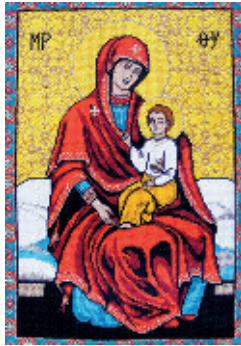
2. Чернігівська Єлецька Богородиця;