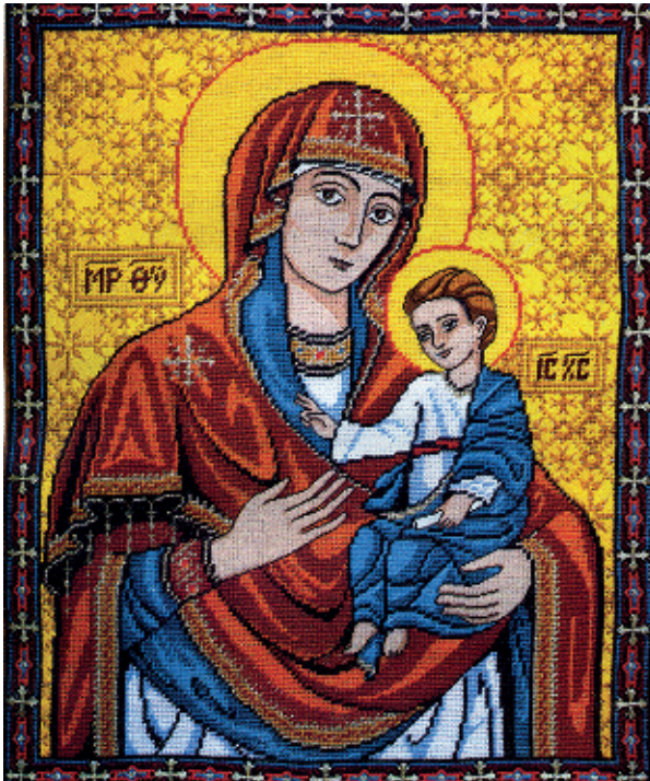
9. Зарваницька Богородиця; 10. Почаївська Богородиця; 11. Чернігівська-Ілін- ська Богородиця;