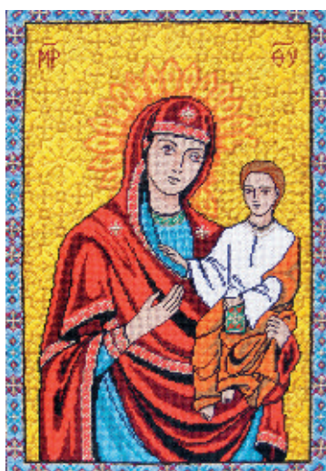
16. Козацька Іржавецька Богородиця;