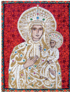
5. Гошівська Богородиця;