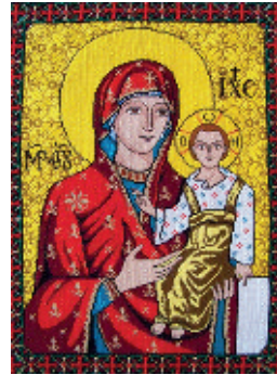
3. Краснобрдська Богородиця;