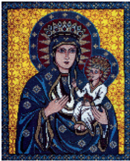
4. Чернівецько-Буковинська Богородиця;