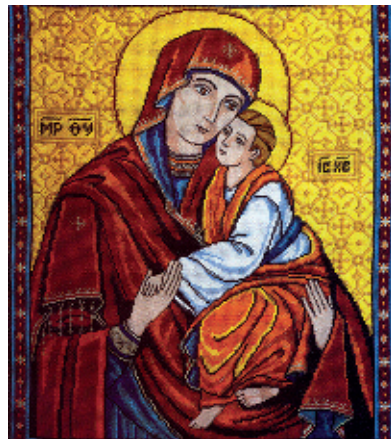
8. Крехівська Богородиця ;