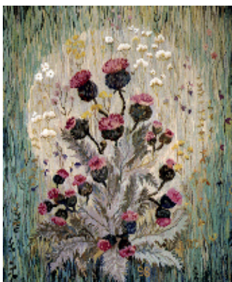
2. Гобелен «Моя квітка – будяк», 1998;