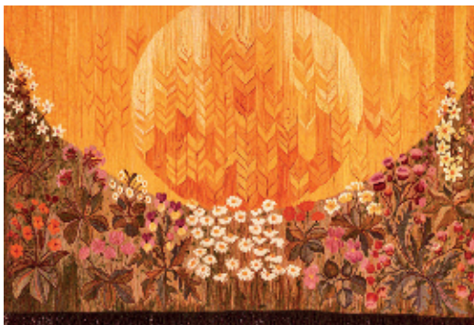
4. Гобелен «Вічний вогонь», 1975;