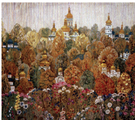
3. Гобелен «Золоті пагорби Києва», 2000;