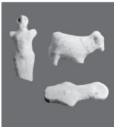
Керамічні скульптурки із трипільських поселень. КМНМГП