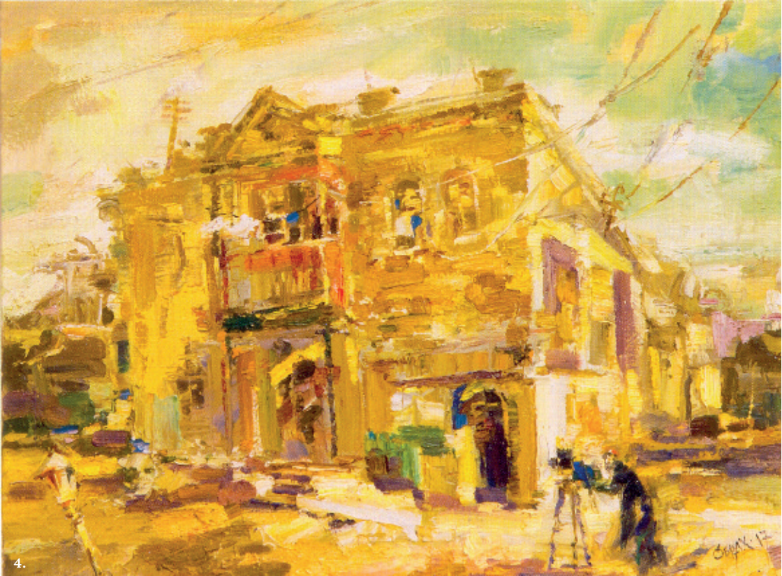
4. Стара вінниця, 2017, п.о.;