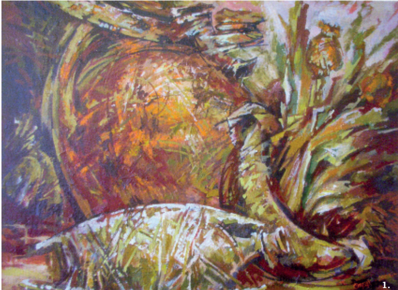
1. Кераміка із сухим зіллям, 2000, п.о.;

Ключові слова: заслужений художник України, живопис, «alla prima», колорит, пленэр, мастихин.