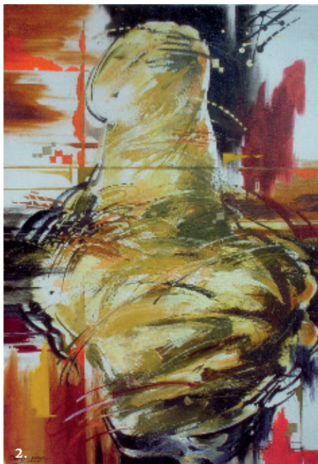
2. Трипільська венера, 2005, п.о.;