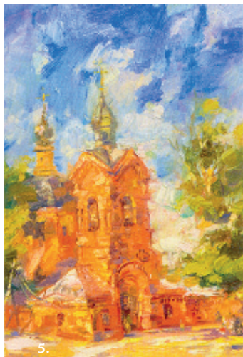
5. Церква-усипальниця Пірогова, 2017, п.о.;