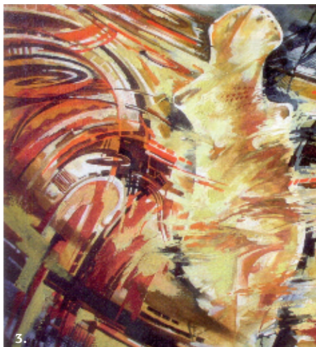
3. Берегиня, 2006, п.о.;