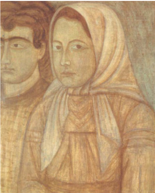
Іл. 2. Т. Бойчук. Хлопець і дівчина. 1918-1919 рр. Картон, темпера. НХМУ. Жс – 587.