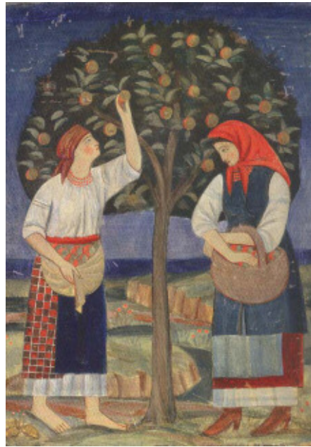
Іл. 3. Т. Бойчук. Біля яблуні. 1919-1920 рр. Картон, темпера. НХМУ. Жс – 455.