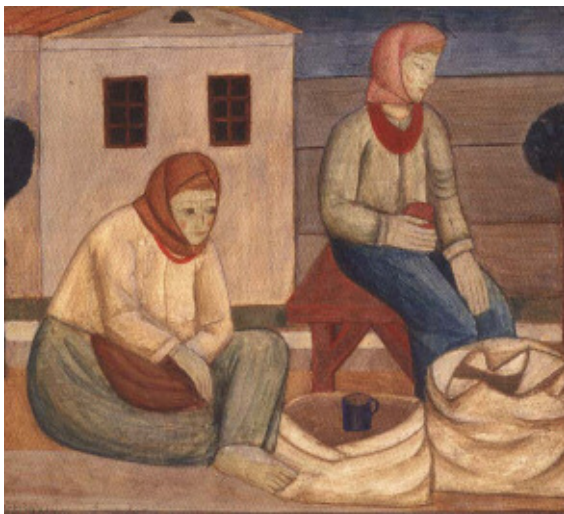
Іл. 4. Т. Бойчук. Дві жінки з насінням. 1916 р. Картон, темпера, НХМУ. Жс - 586