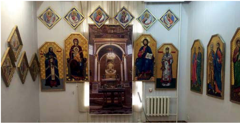
Іл. 4. Вишитий Погонський іконостас.