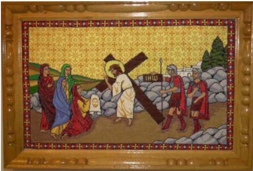
Іл. 5. Ніна Фоменко. Св. Вероніка та Ісус.