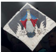
Іл. 8, 9. Ікони вишиті в таборах.