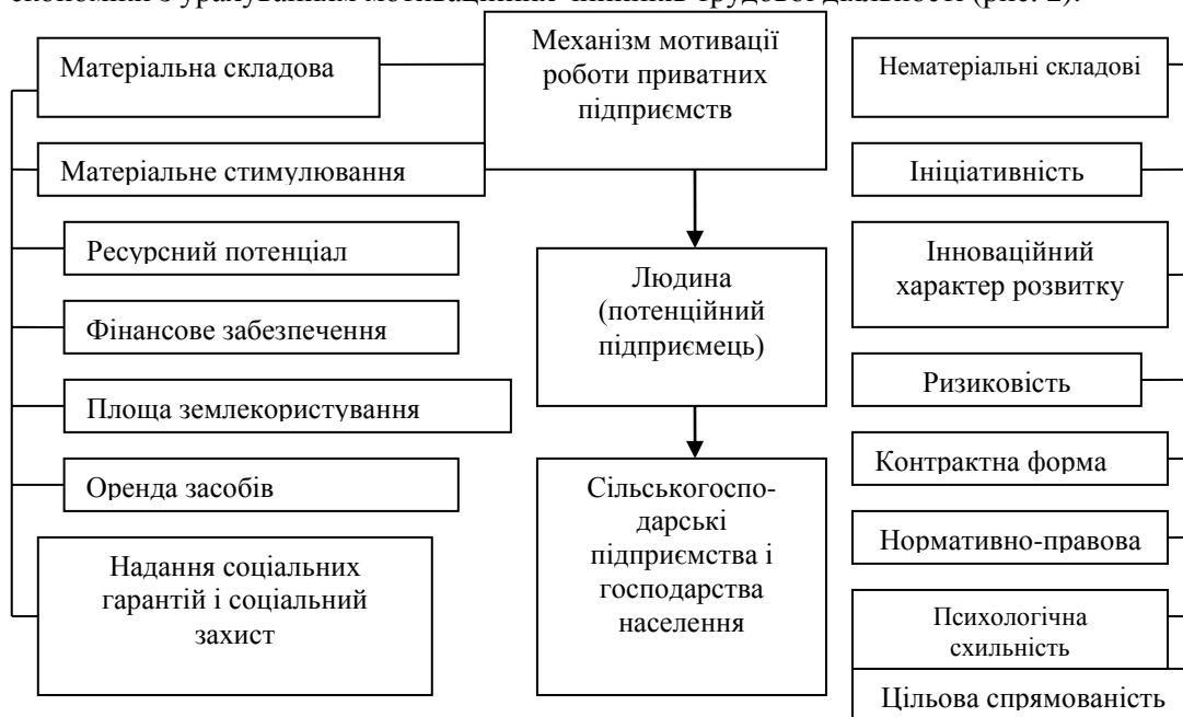
Рис. 2. Механізм мотивації створення і роботи підприємств в аграрній сфері.

виробництва, закупівлі та реалізації продукції на основі кооперування. Реальним напрямом подолання кризових явищ у розвитку приватних підприємств слід вважати розвиток підприємницької діяльності, основними рисами якої є пошук нових, ефективніших засобів використання ресурсів, гнучкість пристосування до потреб і вимог ринкової ситуації, готовність до ризику задля досягнення високих прибутків. Ми можемо теоретично обґрунтувати основи формування і функціонування приватних підприємницьких структур в аграрному секторі економіки з урахуванням мотиваційних чинників трудової діяльності (рис. 2).