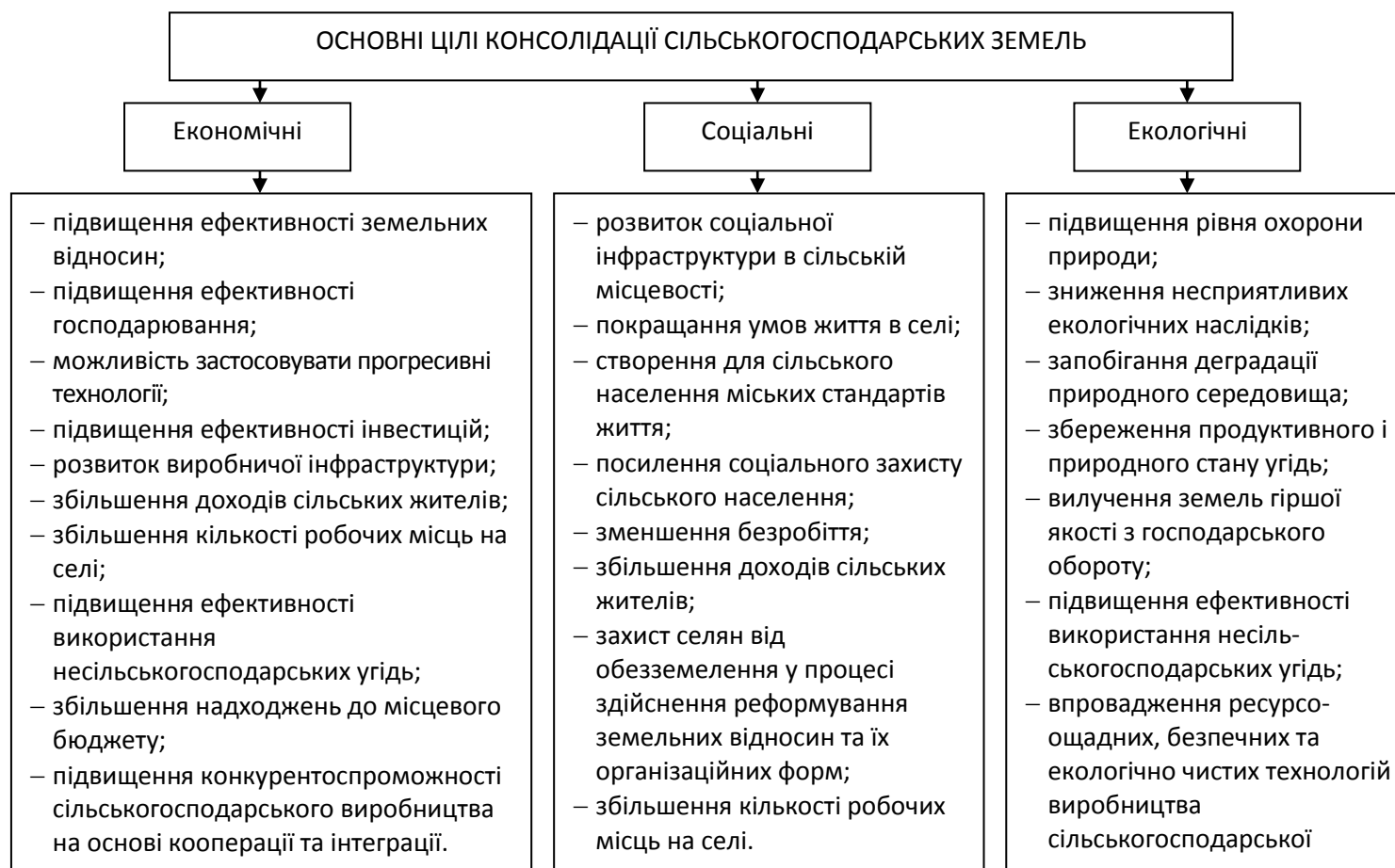
Рис. 2. Цілі консолідації сільськогосподарських земель.