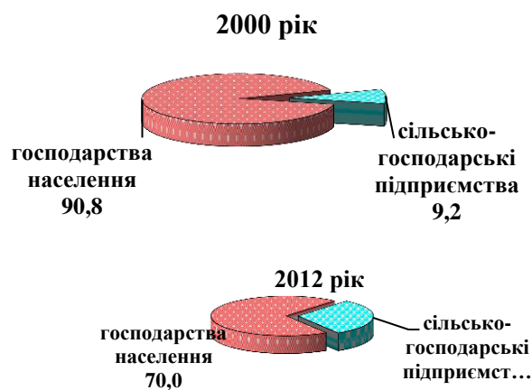
Рис. 1. Структура валової продукції за категоріями господарств, %.

Упродовж 2012 року 37% підприємств працювали збитково (94 млн грн збитків). Лише 29% підприємств завершили рік із рентабельністю реалізації сільськогосподарської продукції понад 15%, з-поміж них – 35% підприємств у рослинництві, 19% – у тваринництві (рис. 2).