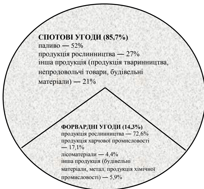
Рис. 2. Обсяги біржової торгівлі за видами угод у 2014 році.

угоди з продукцією рослинництва (72,6 %), харчовими продуктами (17,1 %), лісоматеріалами (4,4 %), іншою продукцією (5,9 %).