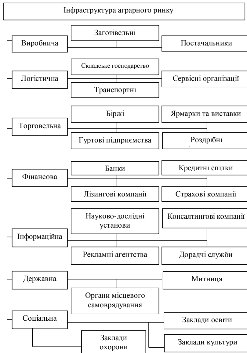
Рис. 1. Елементи інфраструктури аграрного ринку*

Вчені А. Грищенко і В. Соболев під інфраструктурою товарного ринку розуміють систему, що становить собою сукупність елементів, які забезпечують безперерйне багаторівневе функціонування господарських взаємозв'язків, взаємодію суб'єктів ринкової економіки і регулюють рух товарно-грошових потоків [2, с. 37].