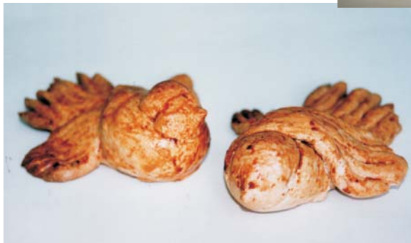
Фото 27: Печиво “жайворонок”. Київська обл. 1980-ті рр. Національний історико-етнографічний заповідник “Переяслав”, Музей хліба. Фото Миколи Семинога, 2001 р.