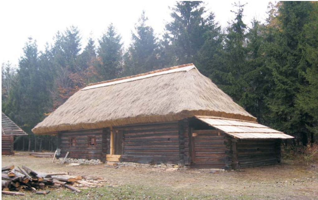
Фото 41: Хага кінця XIX ст. зі с. Липовиці Рожнятівського р-ну Івано-Франківської обл. – після реставрації. Дах покритий сніпками і колоною дошкою. На гребені дерев'яний дашок. Експозиція НМНАПУ, 2010 р.