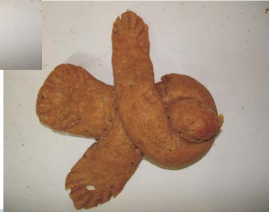
Фото 26: Печиво “жайворонок”.