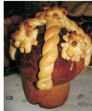
Фото 20: Паска. Київська обл. 1990-ті рр. Народний музей хліба Національного еколого-натуралістичного центру учнівської молоді (НЕНЦ) Міністерства освіти і науки України, Київ.