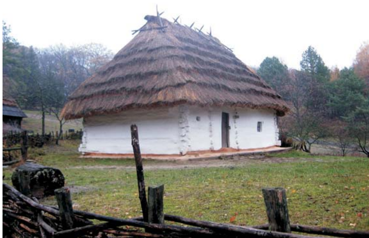
Фото 44: Хата кінця XIX ст. зі с. Медведівців Мукачівського р-ну Закарпатської обл. Дах покритий “жупами”, з валком на гребені. Реставрація 2005 р., НМНАПУ, м. Київ.