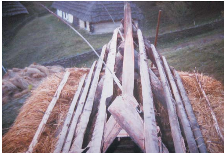
Фото 33: Фрагмент даху млина зі с. Пилипця Міжгірського р-ну Закарпатської обл. Процес покриття даху соломною “внатрус”. Реставрація 2006 р., НМНАПУ, м. Київ.