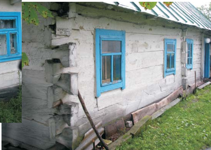
Фото 4: Хата середини XIX ст. у с. Гірках Любешівського р-ну Волинської обл.