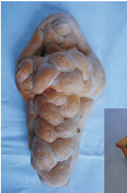
Фото 23: Печиво "хрест". с. Погорілівка Заставнівського р-ну Чернівецької обл. 2007 р. Музей історії села Погорілівка. Фото Людмили Герус, 2008 р.