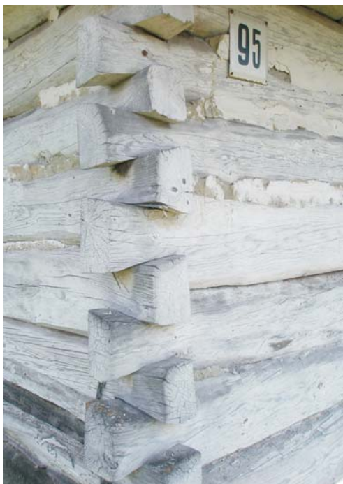
Фото 6: Хата кінця XIX ст. у с. Осівцях Камінь-Каширського р-ну Волинської обл.