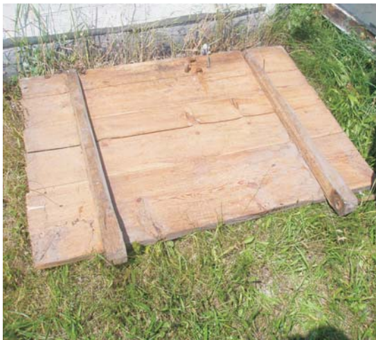
Фото 11: Двері на дерев'яних завісах з хати першої половини XIX ст. у с. Столінських Смолярах Любомльського р-ну Волинської обл.