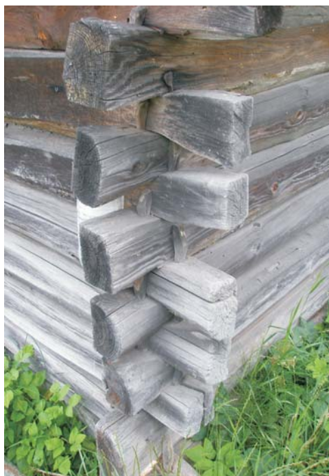
Фото 7: Хата кінця XIX ст. у с. Сошичному Камінь-Каширського р-ну Волинської обл.