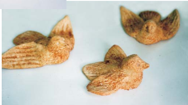
Фото 28: Печиво “жайворонок”. Київська обл. 1980-ті рр. Національний історико-етнографічний заповідник “Переяслав”, Музей хліба. Фото Миколи Семинога, 2001 р.