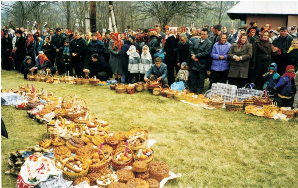
Фото 13: Освячення пасок у с. Космач Косівського р-ну Івано-Франківської обл. 2001 р. Фото Олени Никорак, 2001 р.