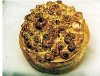
Фото 16: Марія Ісайчук. Паска. с. Космач Косівського р-ну Івано-Франківської обл. 2001 р. Фото Олени Никорак, 2001 р.