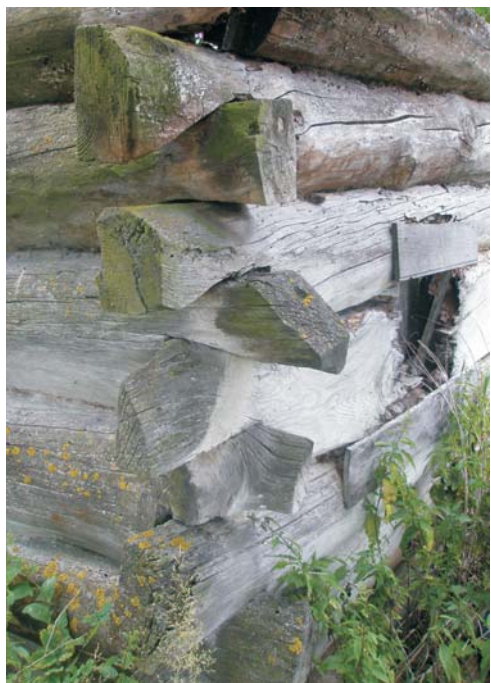
Фото 8: Хата середини XIX ст. у с. Хрипську Шацького р-ну Волинської обл.