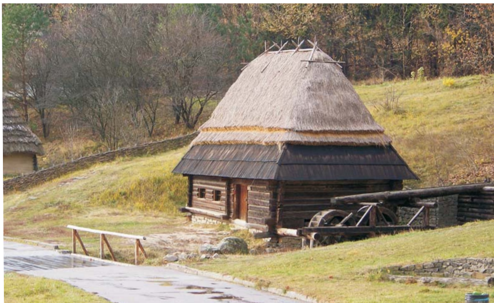
Фото 29: Млин кінця ХІХ ст. зі с. Пилипця Міжгірського р-ну Закарпатської обл. Дах покритий колотою дошкою, “жупами” і “внатрус”. Реставрація 2006 р., НМНАПУ, м. Київ.