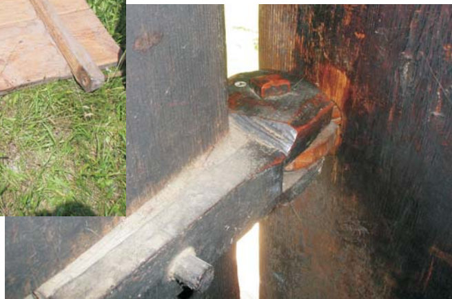
Фото 12: Двері на дерев'яних завісах. с. Плоска Путильського р-ну Чернівецької обл. (Гуцульщина).