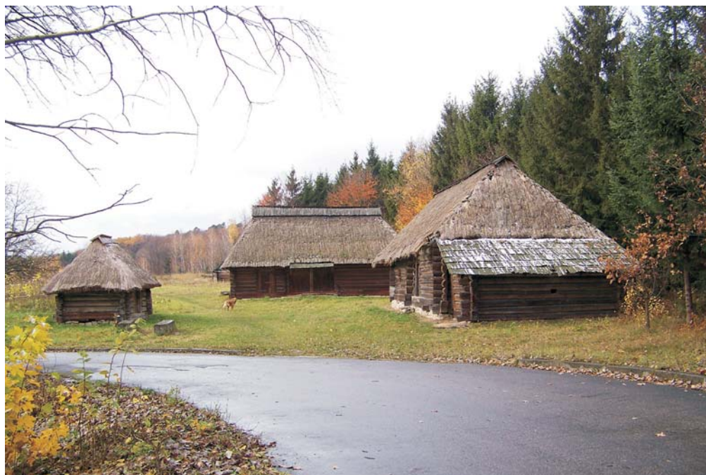
Фото 40: Садиба зі с. Липовиці Рожнятівського р-ну Івано-Франківської обл.: хата, стодола, шопа. Експозиція НМНАПУ, 2008 р.