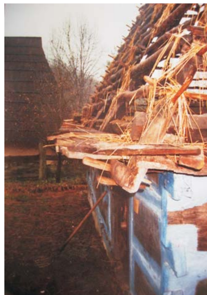
Фото 36: Хата XVII–XVIII ст. зі с. Терелі Тячівського р-ну Закарпатської обл. Фрагмент каркасу даху, підготовленого до покриття соломою “внатрус”. Реставрація 2006 р., НМНАПУ, м. Київ.