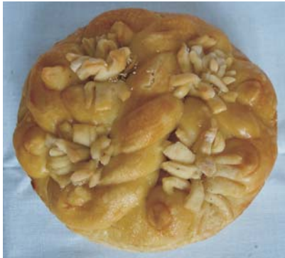
Фото 17: Паска. с. Погорілівка Заставнівського р-ну Чернівецької обл. 2007 р. Музей історії села Погорілівка. Фото Людмили Герус, 2008 р.