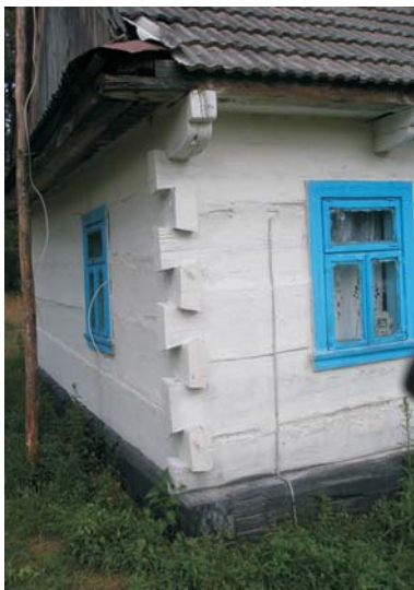
Фото 5: Хата початку XX ст. у с. Столінських Смолярах Любомльського р-ну Волинської обл.