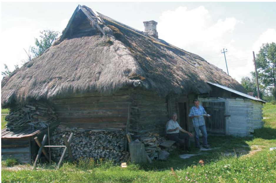
Фото 2: Хата кінця XIX ст. у с. Здомишлі Ратнівського р-ну Волинської обл.