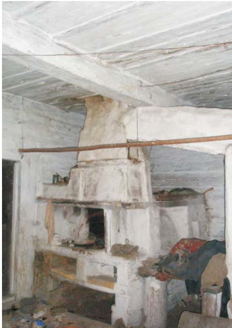
Фото 9: Під у хаті кінця XIX ст. у с. Лишнівці Маневицького р-ну Волинської обл.