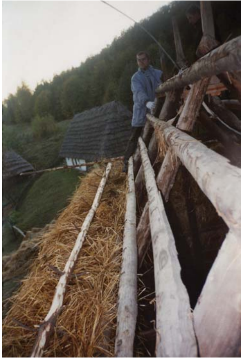
Фото 31: Фрагмент даху млина зі с. Пилипця Міжгірського р-ну Закарпатської обл. Процес покриття даху соломною “внатрус”. Реставрація 2006 р., НМНАПУ, м. Київ.