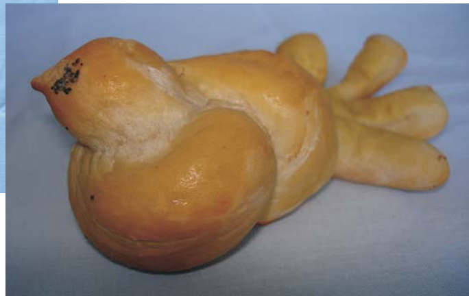
Фото 24: Печиво "жайворонок". с. Погорілівка Заставнівського р-ну Чернівецької обл. 2007 р. Музей історії села Погорілівка. 2008 р.