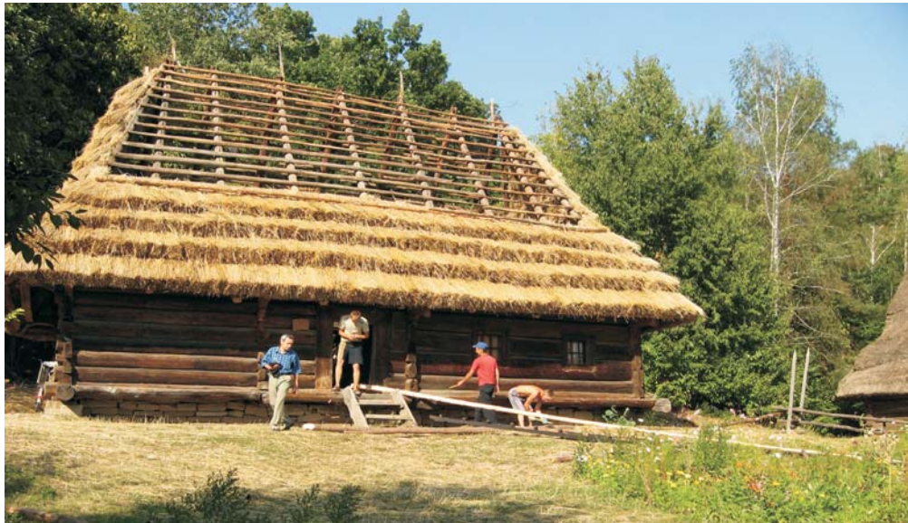
Фото 39: Хата 1841 р. зі с. Рекіт Міжгірського р-ну Закарпатської обл. Покриття даху “жупами”. Реставрація 2008 р., НМНАПУ, м. Київ.