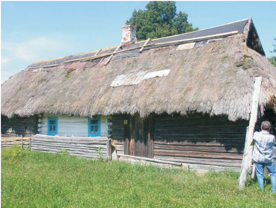
Фото 1: Хата кінця XIX ст. у с. Здомишлі Ратнівського р-ну Волинської обл.