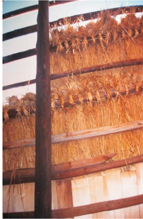
Фото 32: Фрагмент даху млина зі с. Пилипця Міжгірського р-ну Закарпатської обл. Процес покриття даху “жупами”. Реставрація 2006 р., НМНАПУ, м. Київ.