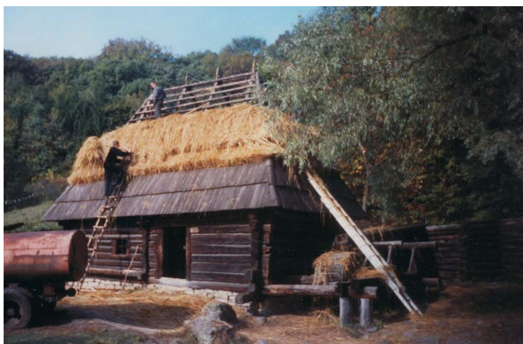
Фото 30: Млин кінця ХІХ ст. зі с. Пилипця Міжгірського р-ну Закарпатської обл. Процес покриття даху. Реставрація 2006 р., НМНАПУ, м. Київ.