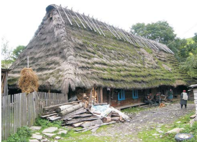
Фото 45: Хата кінця XIX ст., покрита китицями. с. Либохора Турківського р-ну Львівської обл. Серпень 2008 р.