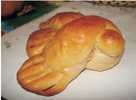
Фото 25: Печиво “жайворонок”.