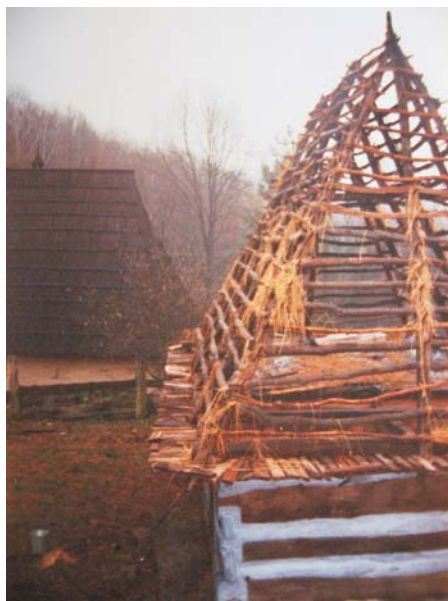
Фото 35: Хата XVII–XVIII ст. зі с. Терелі Тячівського р-ну Закарпатської обл. Каркас даху, підготовлений до покриття соломою “внатрус”. Реставрація 2006 р., НМНАПУ, м. Київ.