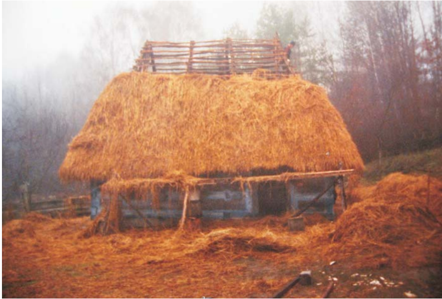
Фото 37: Хата XVII–XVIII ст. зі с. Терєблі Тячівського р-ну Закарпатської обл. Покриття даху соломомою “внатрус”. Реставрація 2006 р., НМНАПУ, м. Київ.