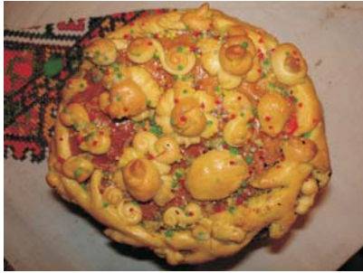
Фото 15: Паска. Тернопільська обл. 2004 р. Народний музей хліба Покрови Пресвятої Богородиці, Львів. Фото Людмили Герус, 2006 р.