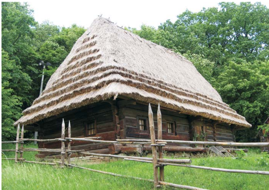
Фото 38: Хата 1841 р. зі с. Рекіт Міжгірського р-ну Закарпатської обл. Дах покритий “жупами” і “внатрус”. Реставрація 2008 р., НМНАПУ, м. Київ.