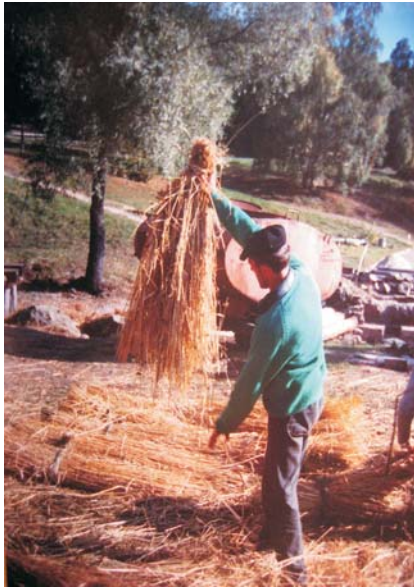
Фото 46: Покривання даху млина зі с. Пилипця Міжгірського р-ну Закарпатської обл. Майстер-покрівельник виготовляє “жупу”. НМНАПУ, м. Київ, 2006 р.