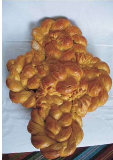
Фото 22: Печиво "хрест". с. Погорілівка Заставнівського р-ну Чернівецької обл. 2007 р. Музей історії села Погорілівка. Фото Людмили Герус, 2008 р.