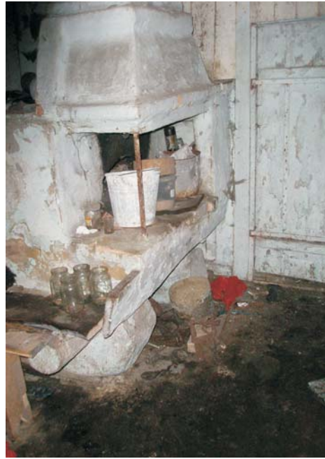
Фото 10: Під у хаті кінця XIX ст. у с. Гірках Любешівського р-ну Волинської обл.