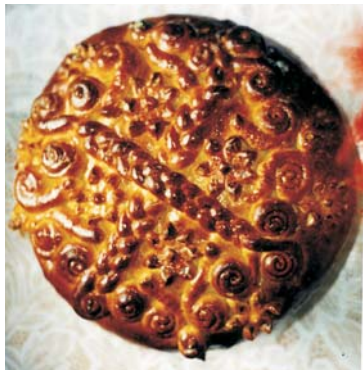
Фото 19: Ганна Уграк. Паска. с. Космач Косівського р-ну Івано-Франківської обл. 2001 р. 2001 р.