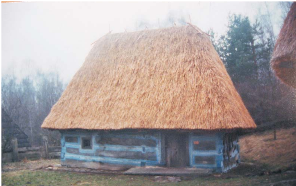
Фото 34: Хата XVII–XVIII ст. зі с. Терелі Тячівського р-ну Закарпатської обл. Дах покритий соломою “внатрус”. Реставрація 2006 р., НМНАПУ, м. Київ.