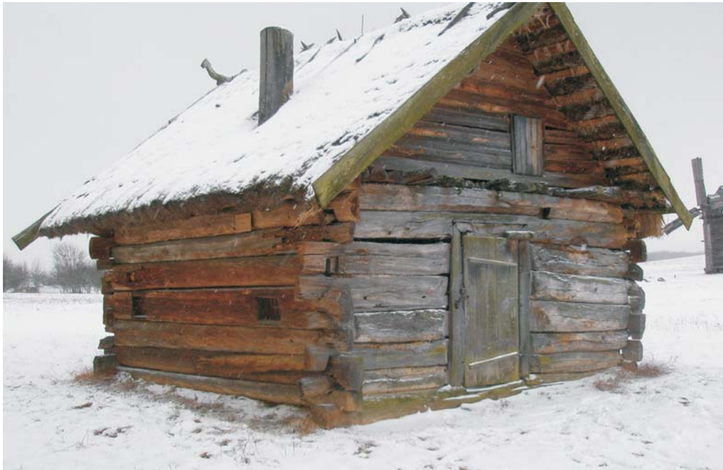
Фото 3: Хата 1587 р. зі с. Самарів Ратнівського р-ну Волинської обл. (Музей народної архітектури, м. Київ).