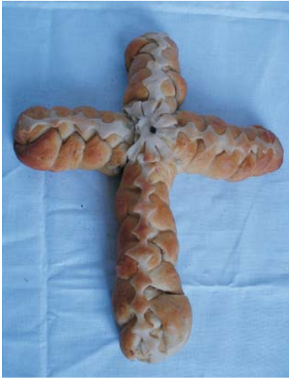
Фото 21: Печиво "хрест". с. Погорілівка Заставнівського р-ну Чернівецької обл. 2007 р. Музей історії села Погорілівка. Фото Людмили Герус, 2008 р.