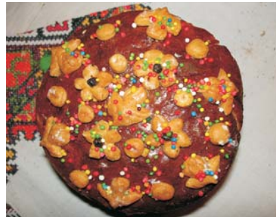
Фото 18: Паска. Тернопільська обл. 2004 р. Народний музей хліба Покрови Пресвятої Богородиці, Львів. Фото Людмили Герус, 2006 р.