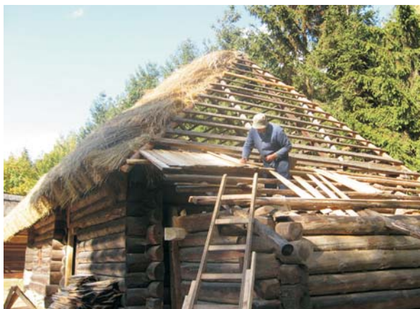
Фото 43: Хата кінця XIX ст. зі с. Липовиці Рожнятівського р-ну Івано-Франківської обл. Процес покриття даху колодою дошкою. Експозиція НМНАПУ, 2009 р.