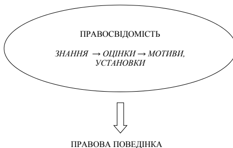
Рис. 1. Структура правосвідомості та її взаємозв'язок з правовою поведінкою

функціонування правової системи, органів юридичної сфери), другий – включає оціночне сприйняття правової дійсності (діяльності правоохоронних та судових органів, рівень довіри до них, оцінка засобів задоволення своїх законних потреб та захисту інтересів, сприйняття права як цінності тощо), третій – установки та мотиви, що є основою поведінкових моделей особистості та готовністю до дії. Без сумніву, всі компоненти між собою тісно пов'язані, зокрема знання формують оціночні ставлення, а останні є основою мотивів поведінки (правомірної чи протиправної) соціальних суб'єктів.