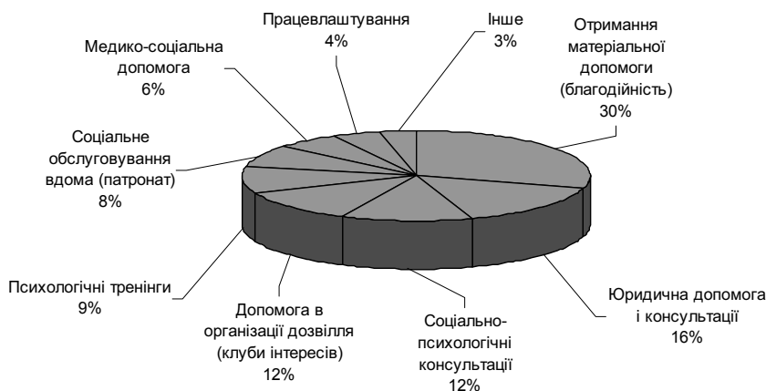
Рис. 2. Соціальні послуги, які отримували мешканці м. Запоріжжя від громадських організацій

Респондентам було запропоновано визначити актуальні суспільно-значимі проблеми (як напрями соціальної роботи), які б могли вирішувати інституції громадянського суспільства. Результати представлені на рис. 3.