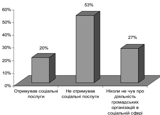
Рис. 1. Показник отримання соціальних послуг від громадських організацій

Як видно з рис. 1, досить незначна частка населення Запорізького регіону зверталася або отримували послуги від громадських організацій.