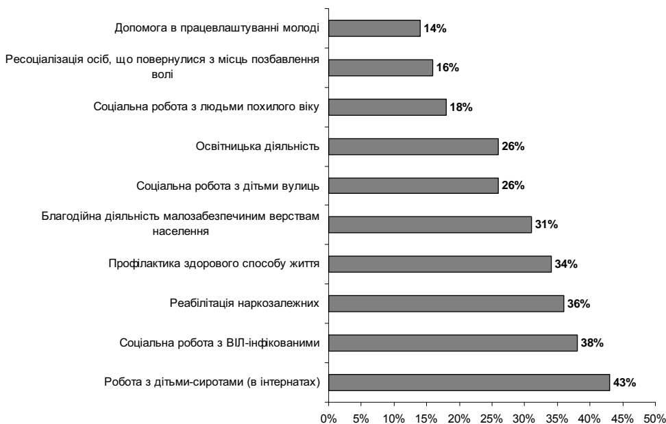
Рис. 3. Актуальні напрями діяльності громадських організацій

Респондентам було запропоновано визначити актуальні суспільно-значимі проблеми (як напрями соціальної роботи), які б могли вирішувати інституції громадянського суспільства. Результати представлені на рис. 3.