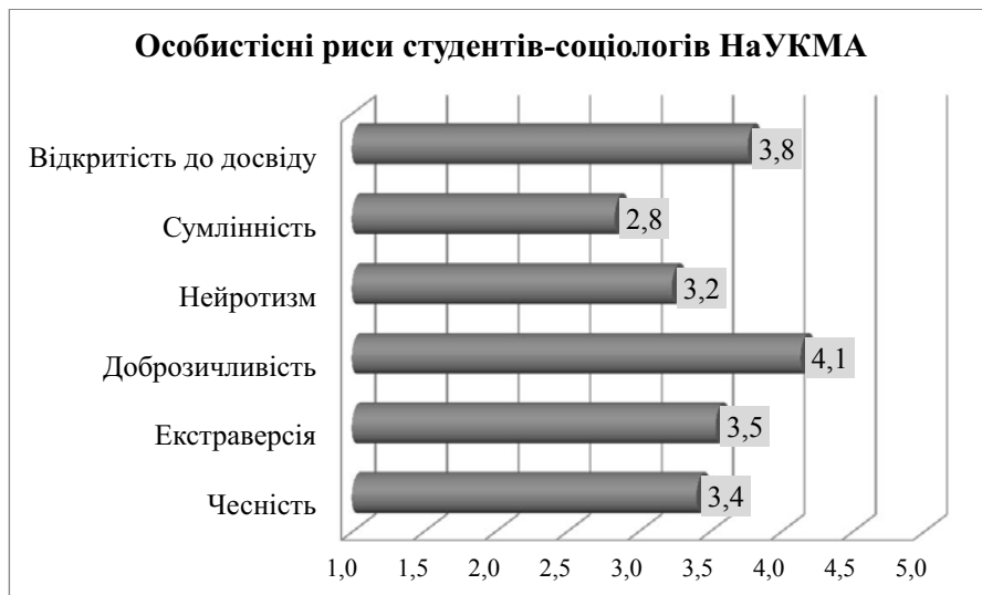
Рис. 1. Ступені прояву особистісних рис студентів-соціологів НаУКМА 1 року навчання (Середні арифметичні значення відповідей на кожне запитання за шкалою від 1 – «зовсім неважливий» до 5 – «дуже важливий»; мінімальний обсяг агрегованої вибірки студентів 2010–2012 років опитування n=122 )

Результати опитування представлено на рис. 1.