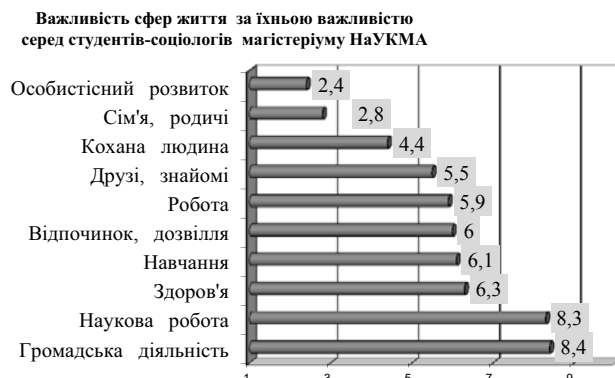
Рис. 3. Важливість сфер життя для студентів-соціологів НаУКМА 2 року навчання магістеріуму (Середні ранги важливості сфер життя для студентів-соціологів НаУКМА 2 року навчання магістеріуму за шкалою від 1 – «найбільш важлива» до 10 – «найменш важлива»; обсяг вибірки студентів 2007 року n=12)

Незважаючи на це, змінюється структура взаємозв'язків між цими ціннісними орієнтаціями. Для соціологів-першокурсників виокремлюються 2 взаємопов'язані (за результатами кореляційного аналізу) групи змінних: 1) сім'я і родичі, кохана людина, друзі і знайомі, відпочинок і дозвілля, здоров'я; 2) громадська діяльність, навчання, наукова робота, особистісний розвиток, робота. Умовно їх можна охарактеризувати як цінності «задоволення» і цінності «досягнення» відповідно. А для студентів-другокурсників магістеріуму чітко виявляються 4 групи змінних: 1) відпочинок, дозвілля, друзі, знайомі, сім'я, родичі; 2) наукова робота, навчання; 3) робота, особистісний розвиток, кохана людина; 4) громадська діяльність. Тобто група цінностей «досягнення» для магістрів розділяється на цінності досягнення у науці, роботі, та у громадській діяльності.