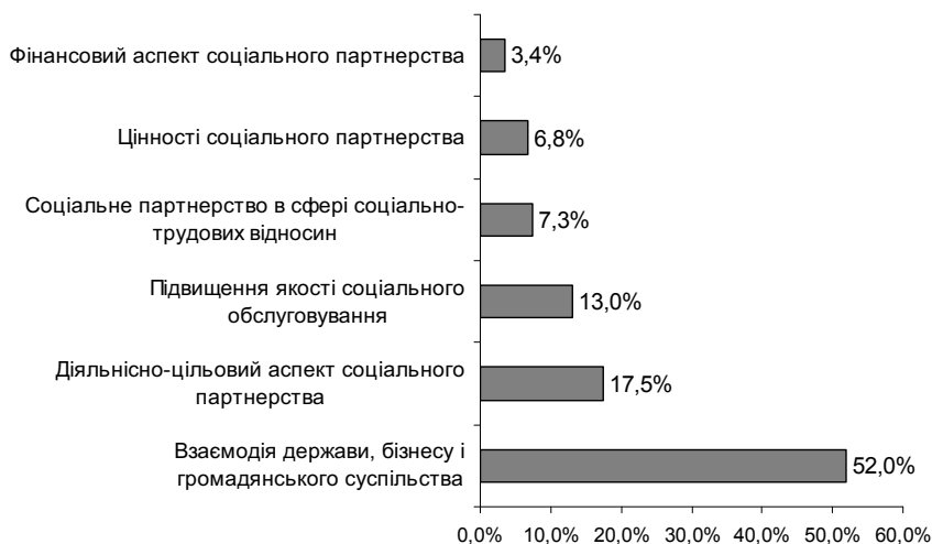
Рис. 3. Змістовний аспект ознайомленості з концепцією соціального партнерства у сфері надання соціальних послуг і управління закладами соціального обслуговування

Для виявлення змістовних особливостей ознайомленості із концепцією соціального партнерства експертам було запропоновано відповісти на відкрите питання анкети: «Як Ви вважаєте, в чому полягає сутність соціального партнерства в управлінні закладами соціального обслуговування?». Усього було отримано 177 відповідей експертів. Унаслідок контент-аналізу висловлювань виділено 6 смислових категорій (рис. 3).