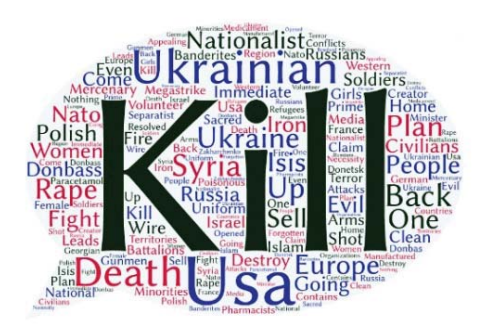
Рис. 2. Приклад візуалізації смислової області тяжіння дискурсу РФ [8, с. 34]

Завдяки контент- та івент-аналізу політичного дискурсу, котрий транслюється через законодавчі акти, ЗМІ та інші джерела, можна візуалізувати фазову динаміку соціальної системи на смисловому тлі. Рис. 2 демонструє одну з таких спроб візуалізувати контент зовнішньополітичного дискурсу Російської Федерації щодо України.