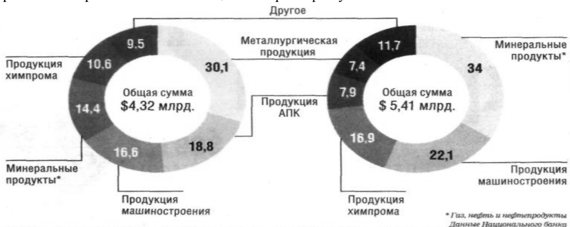
Рис. 1. Структура импорта-экспорта Украины в августе, %

Интересно, что более всего росли поставки из стран, богатых на нефть и газ. Так, импорт из России вырос вдвое, из Ирака - в 5,6 раза, Кувейту - в 10 раз, Саудовской Аравии - в 2,7 раза, Нигерии - в 13 раз. В самом деле, поставки нефти и газа в Украину стремительно росли: за семь месяцев импорт нефти увеличился на 80%.