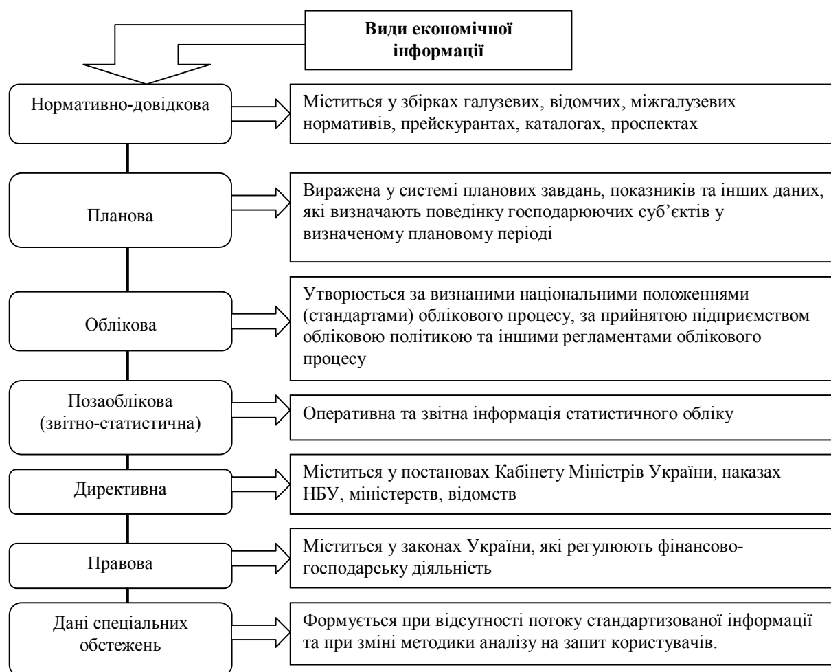
Рис. 1. Класифікація економічної інформації*

Інформація є невичерпним ресурсом, використання якого однією людиною не виключає можливостей його використання іншими людьми. Конкретна інформація може бути використана різними суб'єктами в різних місцях. Враховуючи те, що конкретні види інформації можуть мати надзвичайне значення для забезпечення конкурентоспроможності підприємства, галузі, економіки країни, то ці види інформації захищаються правами інтелектуальної власності. Ці права обмежують доступ до певної інформації та регулюють відносини щодо використання доходу, отриманого від її споживання [1., с. 32]. Для проведення аналізу фінансових результатів використовують різні види економічної інформації (див. рис. 1).