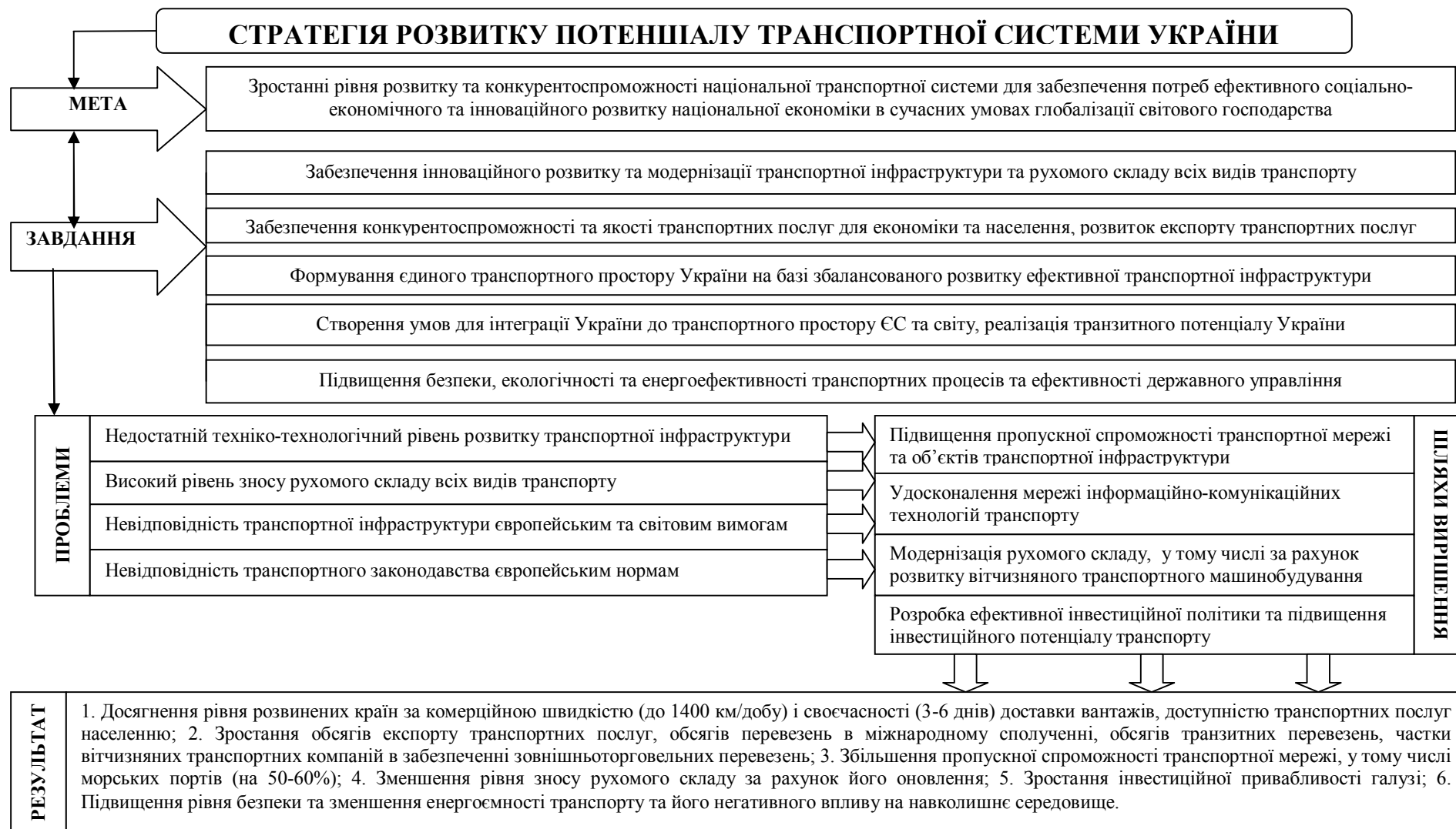
Рис. 3. Механізм розробки та реалізації стратегії розвитку потенціалу транспортної системи України