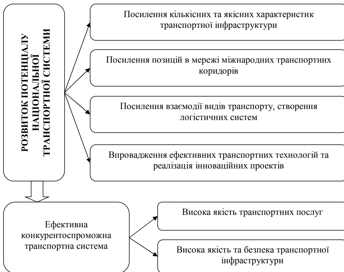
Рис. 1. Напрямки розвитку потенціалу транспортної системи України

Основними напрямками розвитку транспортного сектору економіки України на період до 2020 року є: