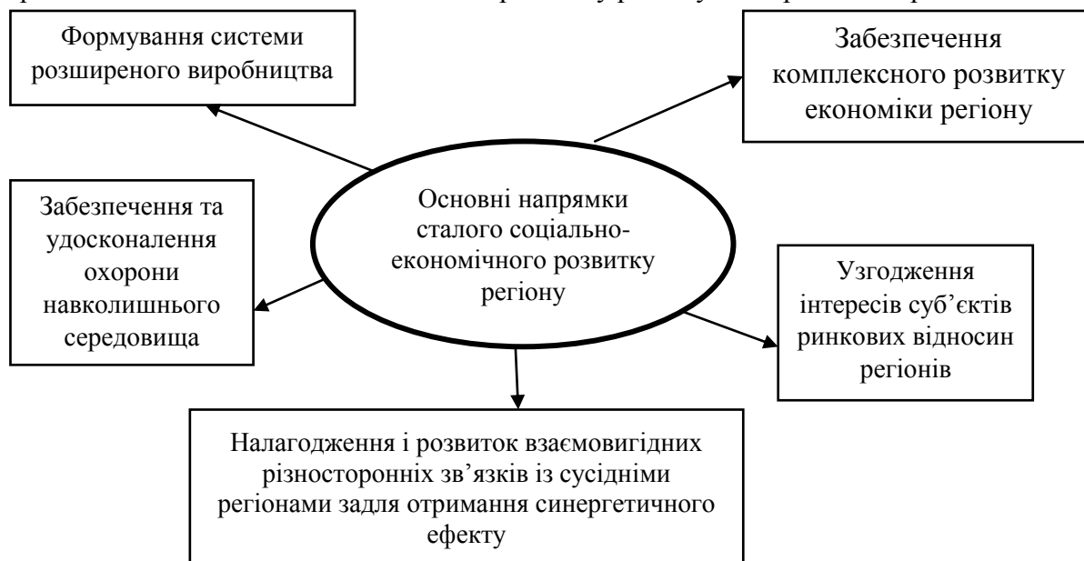
Рис. 3. Напрями сталого соціально-економічного розвитку регіону

Труднощі, що виникли у зв'язку зі світовою кризою, спричинили за собою коригування державної регіональної політики, в частині зсуву акцентів з забезпечення пропорційного розвитку регіонів на переважне фінансування стійких, інноваційно активних територій, здатних стати локомотивами зростання і виведення економіки всієї країни з кризи, з урахуванням того, що є життєво важливим для кожного регіону. Основні напрями сталого соціально-економічного розвитку регіону відображені на рис. 3.