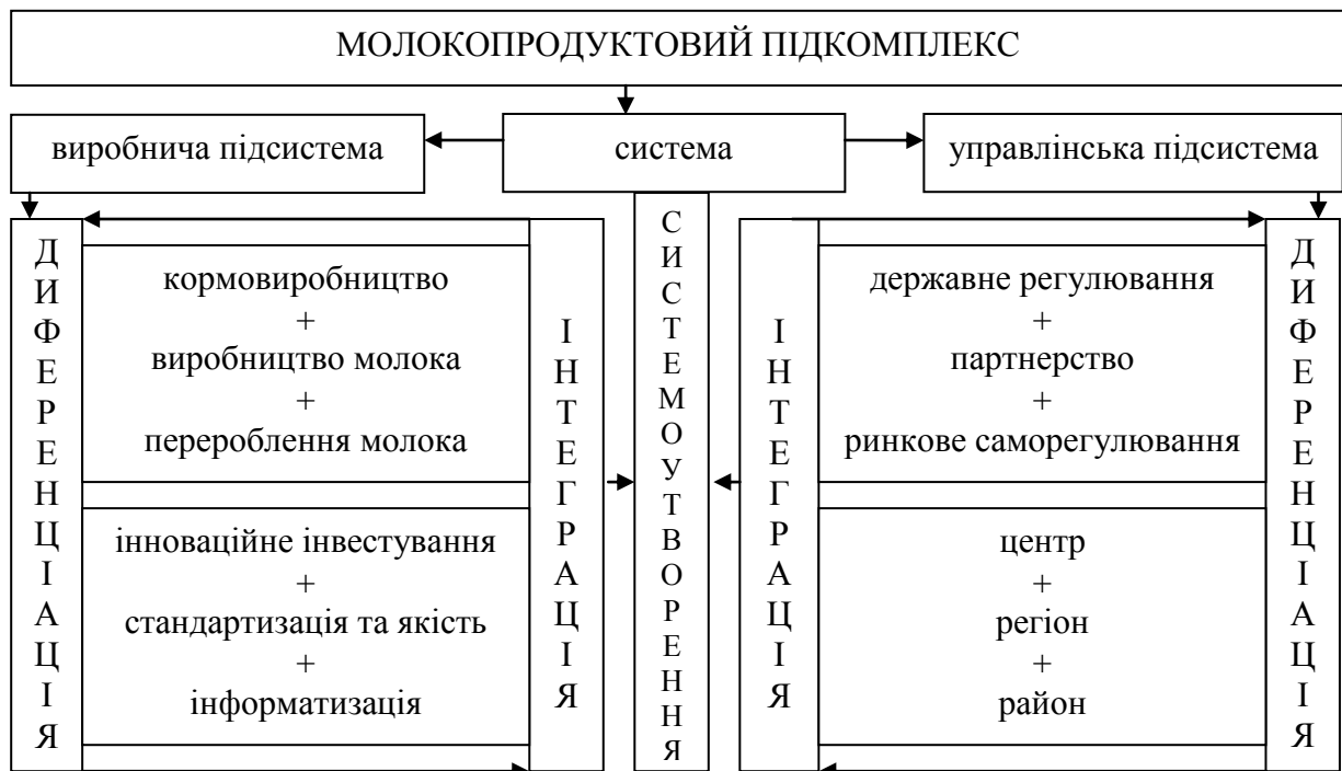
Рис.2. Принципова модель системоутворення у молокопродуктовому підкомплексі

Пріоритетними напрямками досягнення стратегічних цілей є: забезпечення продовольчої безпеки держави шляхом: забезпечення якості та безпечності харчових продуктів, дотримання вимог до їх виробництва у результаті удосконалення системи сертифікації виробництва і стандартизації, впровадження на усіх підприємствах переробної та харчової промисловості систем управління якістю та безпечністю харчових продуктів, створення мережі лабораторій для визначення рівня якості сільськогосподарської продукції, делегування саморегульним об'єднанням на засадах взаємовідповідальності частини повноважень щодо здійснення контролю за відповідністю сільськогосподарської продукції національним стандартам.