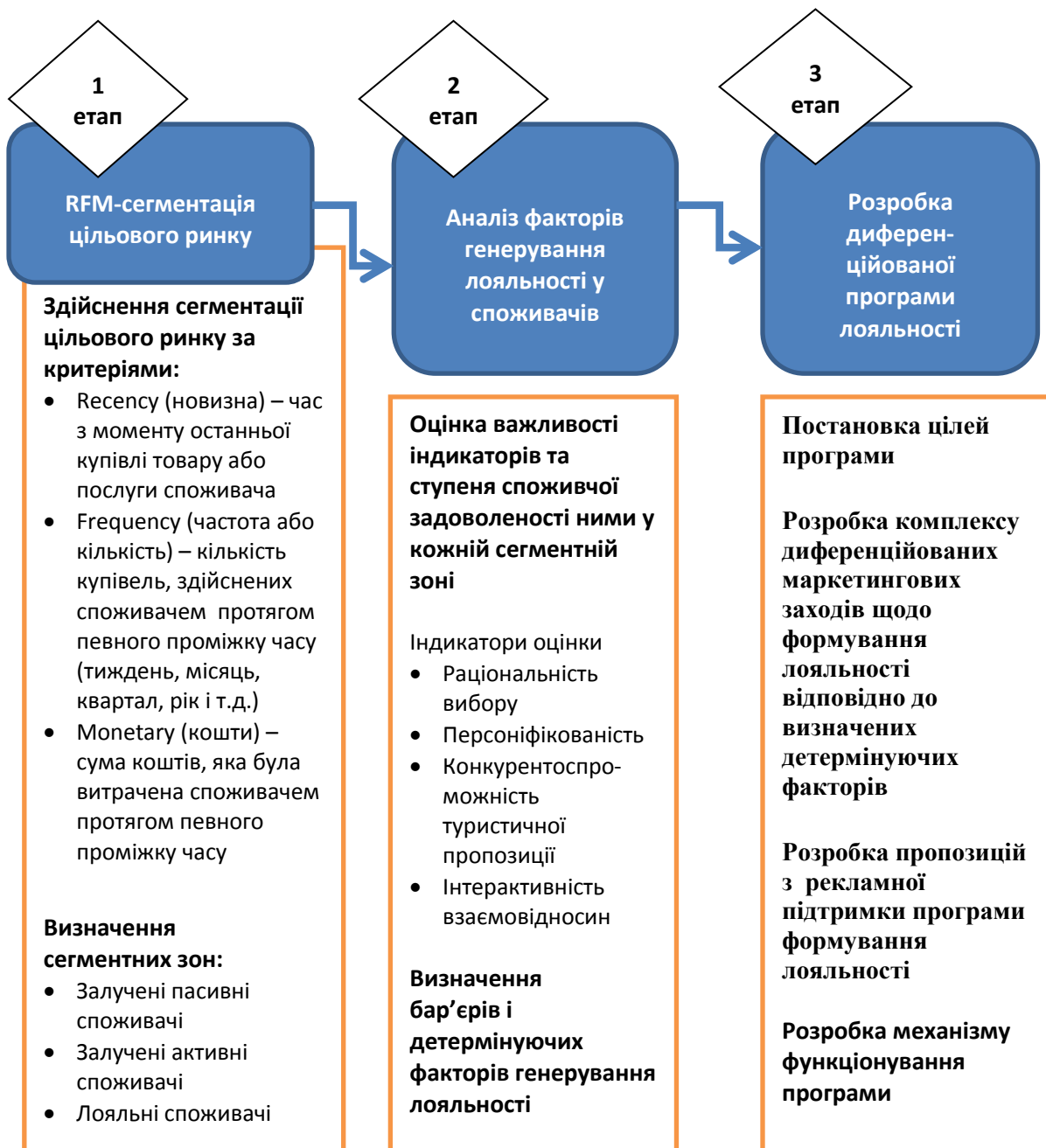
Рис. 2. Етапи процесу формування лояльності споживачів на ринку туристичних послуг

Викликає також науковий інтерес підхід, запропонований Є.М. Кайлюк, відповідно до якого підприємства на ринку туристичних послуг повинні розглядати процес формування споживчої лояльності як послідовність таких етапів [12]: