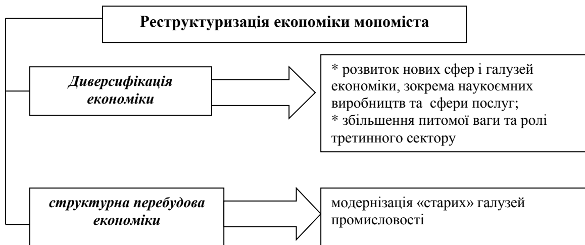
Рис. 1. Шляхи реструктуризації економіки мономіста

Узагальнення зарубіжного досвіду показує, що диверсифікація зазвичай проходить двома шляхами: диверсифікація економіки за рахунок розвитку нових галузей або модернізація наявних виробництв (рис. 1) [3].