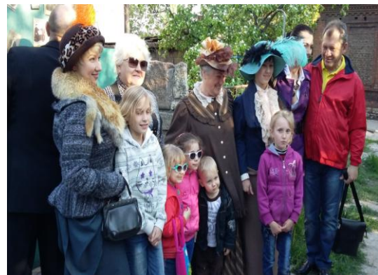
(сотрудники краеведческого музея с экскурсантами)

Сюрпризы поджидали нас на каждом шагу. Только мы вынырнули из мира фотоискусства, как тут же окунулись в мир печатной индустрии. Нас встретил городской газетчик с личным номером 15 на форменной одежде. Дело в том, что продажа газет на улицах города разрешалась лицам, состоящих на службе при редакциях. Строгий, но все же милый реализатор газеты «Приазовский край» так умело анонсировал новости выпуска от 17 мая 1897 г. № 129, что мы не дрогнули заплатить 5 целковых за номер.