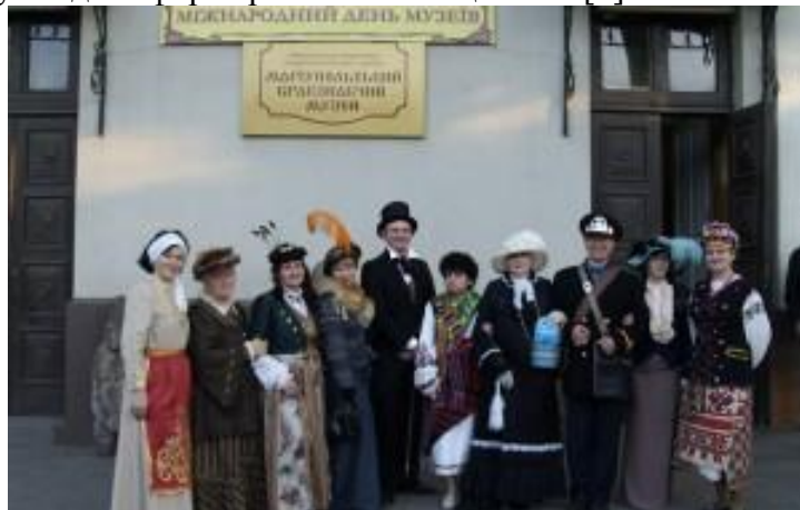
(сотрудники краеведческого музея)

А произошло это благодаря Международному дню музеев, который был установлен по решению XI Генеральной конференции Международного совета музеев (ICOM – International Council of Museums) в 1977 г. 18 мая под девизом «Музеи – это важное средство культурного обмена, обогащения культур и развития взаимопонимания, сотрудничества и мира разных народов». В этот день или накануне музеи открывают свои двери для всех желающих, совершенно бесплатно и с радостью показывая свои выставочные залы, новые экспонаты. На 2015 год была предложена общая тема – «Музеи для сформированного общества» [4].