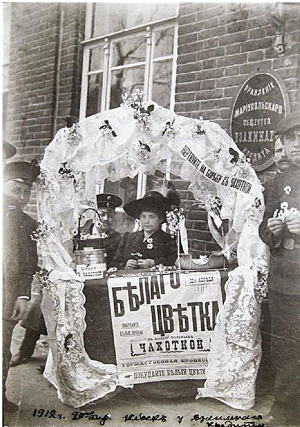
На фотографіях зборщики средств на боротьбу с чахоткою (туберкулезом).

(День белого цветка. г. Мариуполь, 1912 г.)