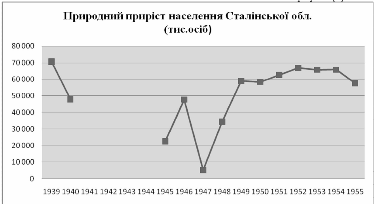
Графік 1 [5]

Для того, аби виявити регіональні відмінності демографічних процесів на територіях, чисельність населення яких є нерівнозначною, в демографії прийнято вираховувати показники на кожну тисячу населення (проміле) [3]. Проаналізувати загальний коефіцієнт природного приросту можна за допомогою Графіку 2.