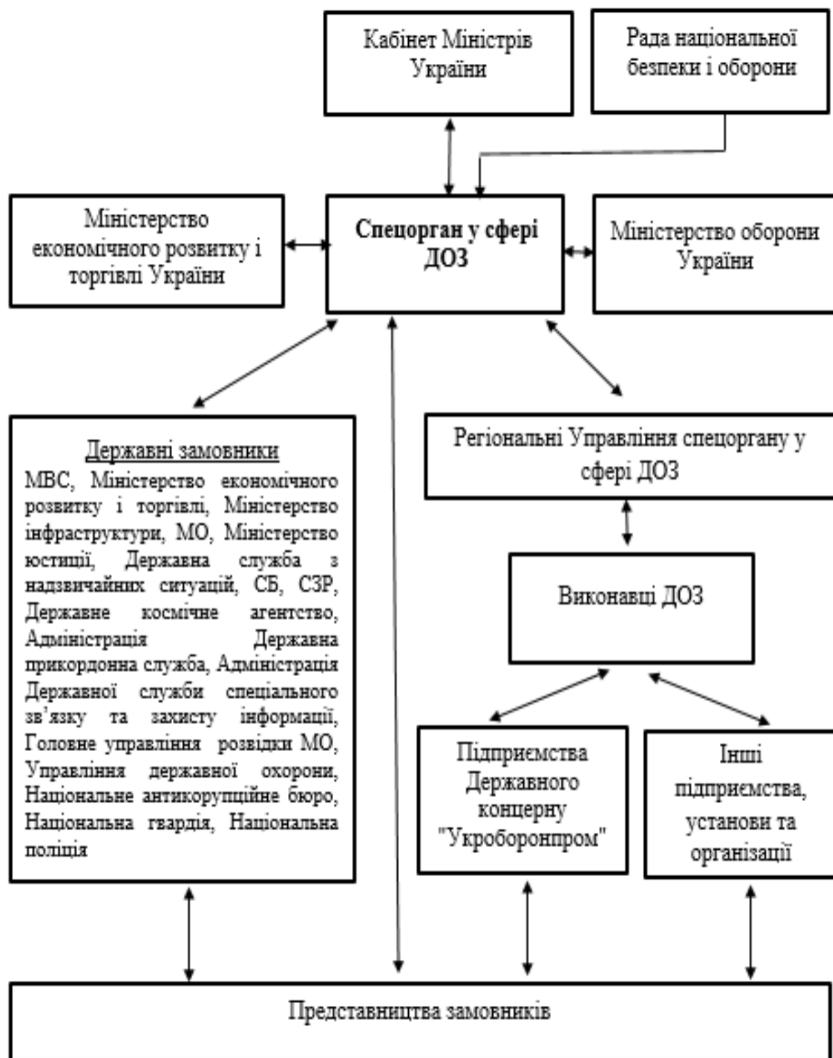
Рис. 4. Організаційна структура взаємодії органів виконавчої влади України у сфері ДОЗ в Україні, що пропонується