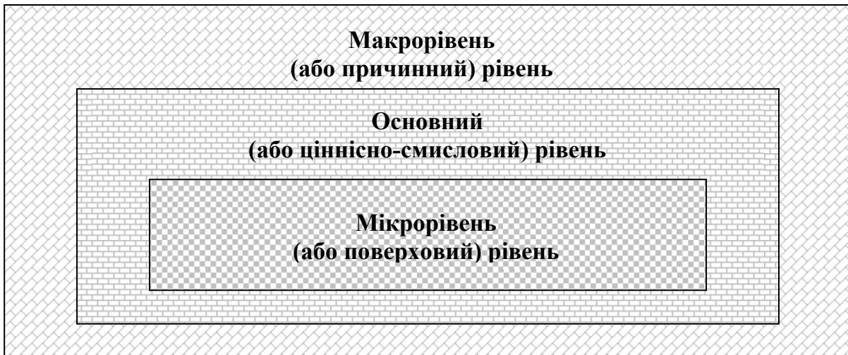
Рисунок 1 – Соціально-психологічна модель наслідків військового полону

психічну травму, викликану перебуванням військовослужбовця у військовому полоні.