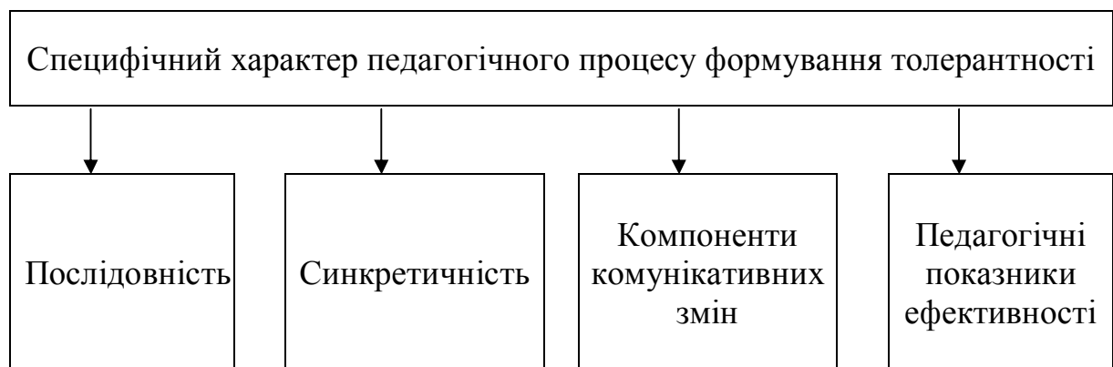
Рис. 2. Складові педагогічної моделі у педагогічному процесі формування толерантності у студентів вищих педагогічних навчальних закладів

Створюючи модель (див. рис. 1), ми виходили з позиції, що формування толерантності майбутніх педагогів – це модель специфічного педагогічного процесу послідовної, синкретичної, комунікативної зміни її компонентів за їхніми критеріями та педагогічними показниками ефективності (рис. 2).