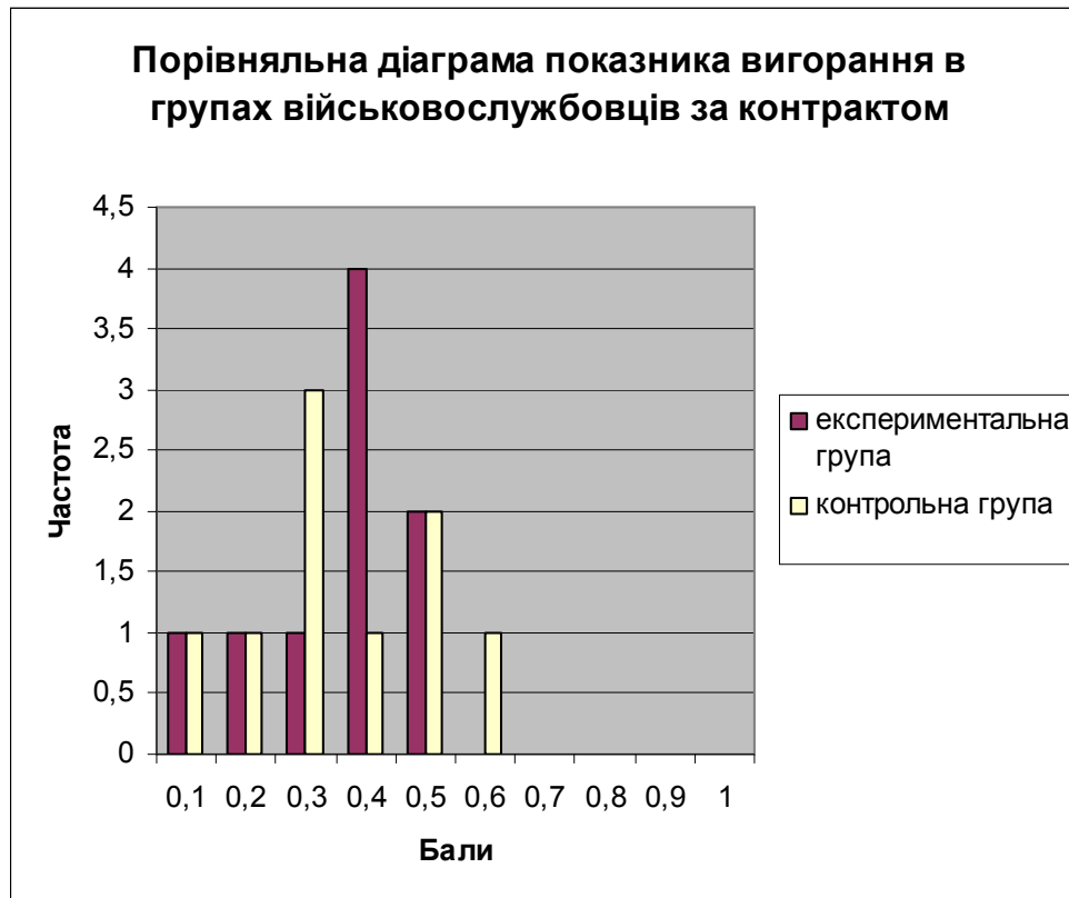
Рисунок 3 – Порівняльна діаграма показника вигорання в групах військовослужбовців за контрактом

про наявність позитивних кореляцій між станом професійного вигорання у посадових осіб органів і підрозділів ДПС України та індивідуальними траєкторіями їхнього професійно-особистісного розвитку.