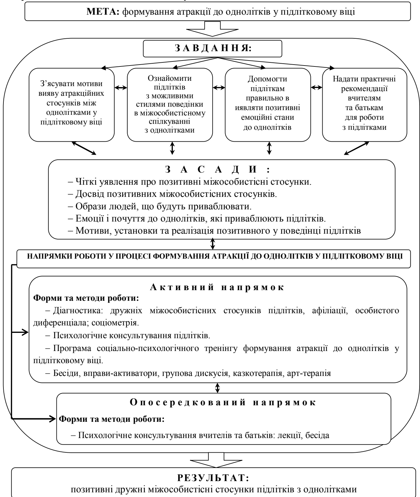
Рисунок 1 – Модель системи роботи практичних психологів навчальних закладів з формування атракції до однолітків у підлітковому віці

компонентів атракції. Основною метою цього етапу був розвиток когнітивного, емоційного і поведінкового компонентів атракції у підлітковому віці. Третій етап передбачав закріплення отриманих умінь та навичок щодо покращення і гармонізації міжособистісних стосунків підлітків зі своїми однолітками.